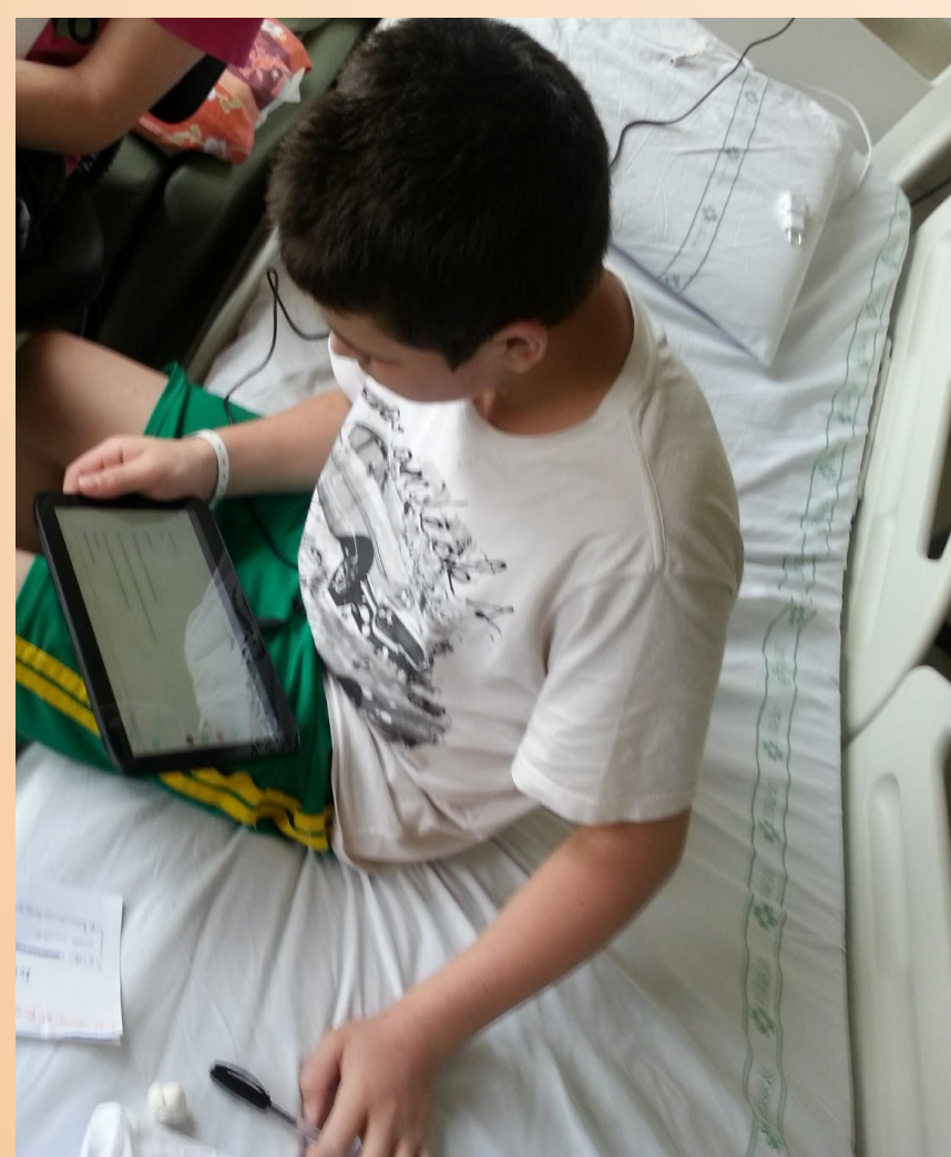
Pacientes participando da construção do game como instrumento de percepção dos sujeitos com FC.