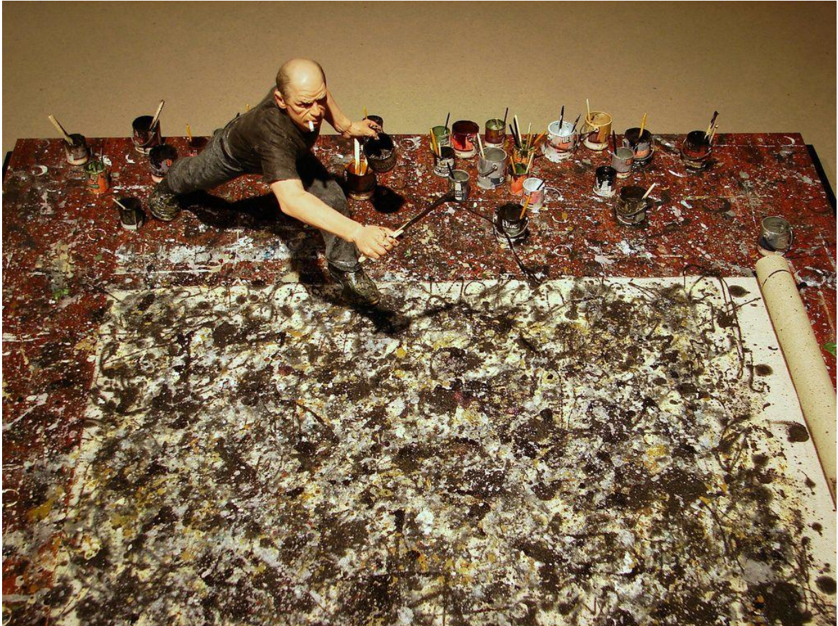
Figura 1: Jackson Pollock pintando em 1947; foto: acervo de Peggy Guggenheim. Disponível em http://www.galeriemagazine.com

Autor caminha sobre a obra. Leva consigo o que esta já é e principalmente o que ela e ele ainda não puderam ser. O autor é obra misturada e obra misturante. Obra borrada de autor, autor borrado de obra, desfaçatez de realidades que insistem em fragmentar o eu e aquele outro eu . Pura intensidade. Caminho trilhado dentro do papel; o autor que caminha leva um pouco dele mesmo para fora do quadro. A pintura que desenha o chão não virá a ser obra porque vida não tem moldura. Porque vida é hermenêutica impossível. É dar moldura ao pouco que prendemos dentro e, principalmente, para o muito que deixamos escapar para fora.