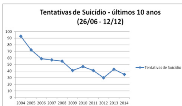
Figura 1 – Registros de tentativas de suicídio nos últimos 10 anos no HPS.

Registros sobre casos de tentativa de suicídio nos últimos 10 anos do HPSPA mostram que houve um parâmetro descendente. Conforme podemos observar, no ano de 2004, 93 pessoas tentaram suicídio; já em 2014, esse número foi de 35 pessoas. Dados coletados com a Companhia de Processamento de Dados do Município de Porto Alegre (Procempa) revelam o parâmetro das tentativas de suicídio dos últimos 10 anos, conforme a Figura 1.