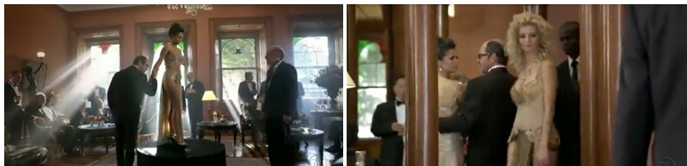
Figura 1. Frames do primeiro capítulo da novela Salve Jorge .

Os quatro minutos iniciais de Salve Jorge são destinados a apresentar a localização de onde passará a trama, tendo como ponto alto o leilão de uma traficada. Algumas características são explicitadas pelo leiloeiro, dentre elas a maioria e o fato da traficada ser brasileira. Tais informações reforçam ou podem ser associadas à pseudogarantia da legalidade da atividade (pela maioria) bem como a característica da nacionalidade (brasileira), considerada um atributo pela visibilidade da mulher latina em âmbito internacional.