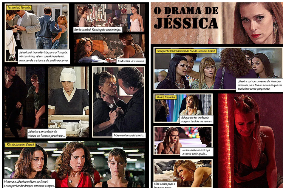
Figura 4. HQ: O Drama de Jéssica.

O investimento em conteúdos mais visuais tende a contribuir para que as informações possam ser assimiladas mais facilmente pelos internautas. Ao emprestar uma nova forma de tradução do texto narrativo em HQ, pode transformar a personagem Jéssica em uma super-heroína, comumente observado em produções desse gênero. Além disso, em HQs com super-heróis tem-se o recurso de um disfarce para ocultar a identidade do protagonista. Nesse caso, o disfarce é o próprio silêncio do crime.