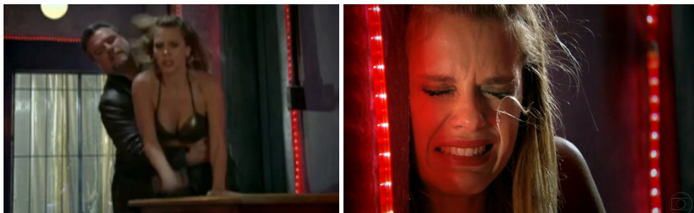
Figura 2. Cenas que remetem ao estupro de Jéssica.

A história de Jéssica foi inspirada na vida de Simone Borges, vítima do tráfico e morta na Espanha em 1996. Com Morena, Jéssica tentou escapar e foi obrigada a servir de mula de droga. No Brasil, descobriu quem era a líder da quadrilha e acabou morta.