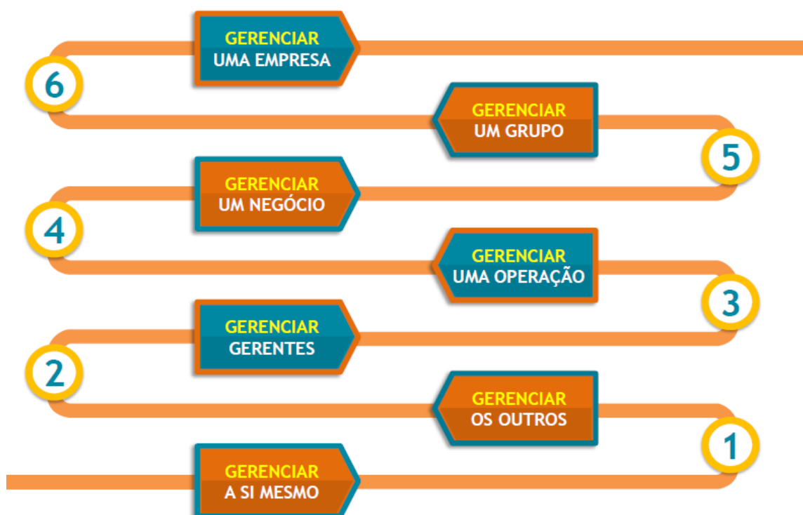
Figura 3 – Pipeline da Liderança

As seis transições propostas pelo autor são identificadas conforme a figura 4, a seguir: