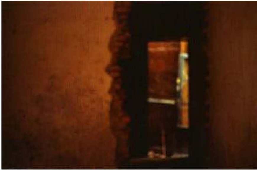
Figura 1 - Jéssica Mangaba. Sem título, Série No Álbum, dimensões variáveis, 2009.