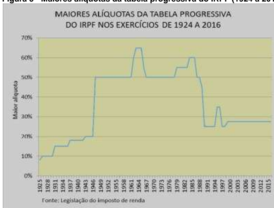
Figura 5 - Maiores alíquotas da tabela progressiva do IRPF (1924 a 2016).