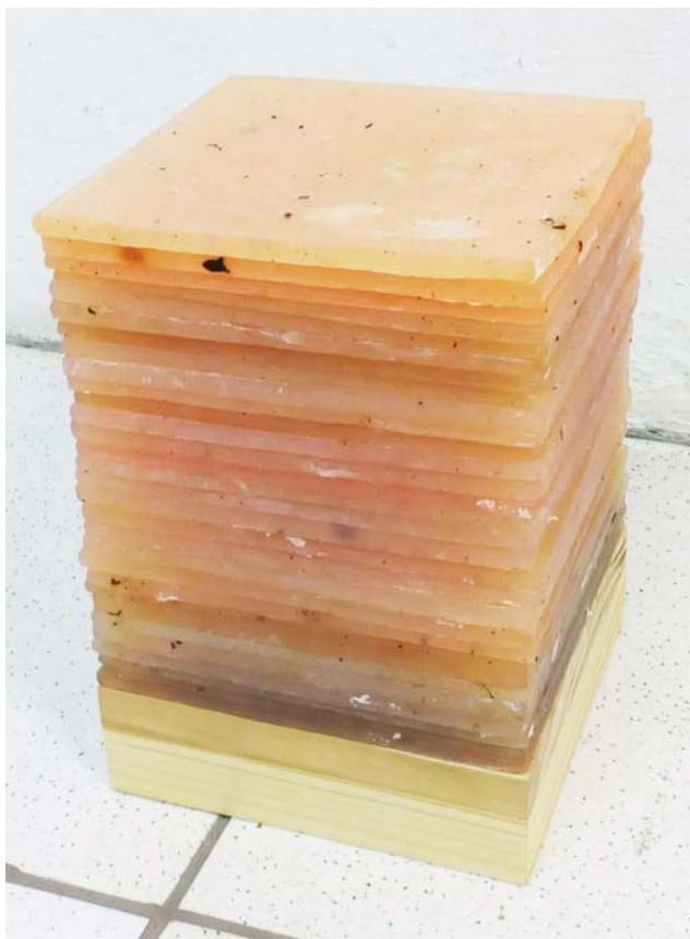
Figura 3 · Fercho Marquéz, Anexo Goiabeira: cova sem identificação (coluna de glicerina), 2017. Suporte de madeira e 30 placas manipuláveis de glicerina, 20cmx38cmx20cm.