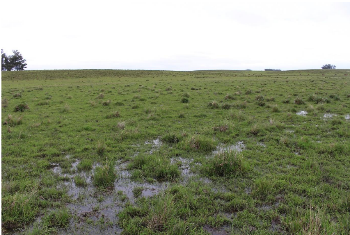
Figura 4. Exemplo de sítio “úmido”.