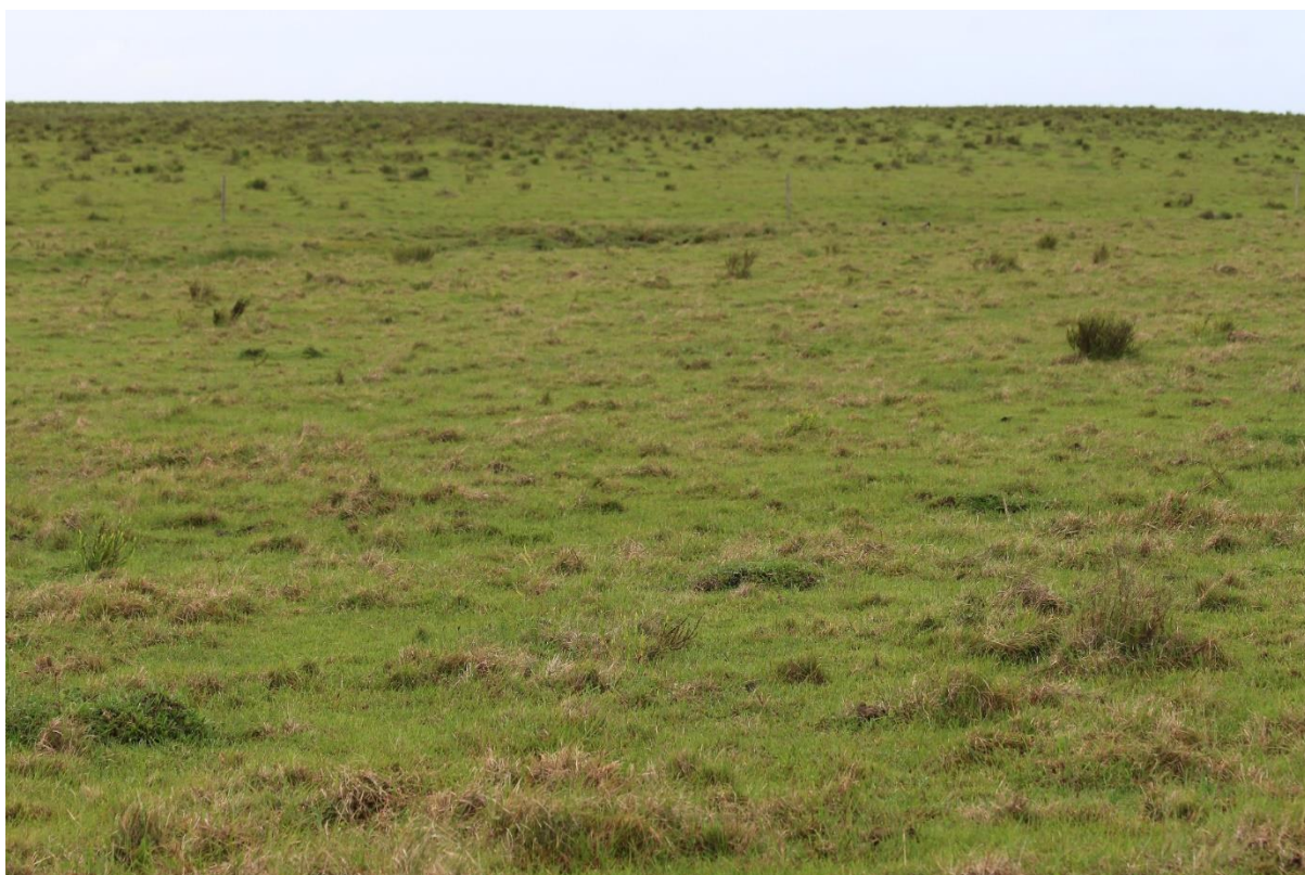
Figura 3. Exemplo de sítio “limpo”.