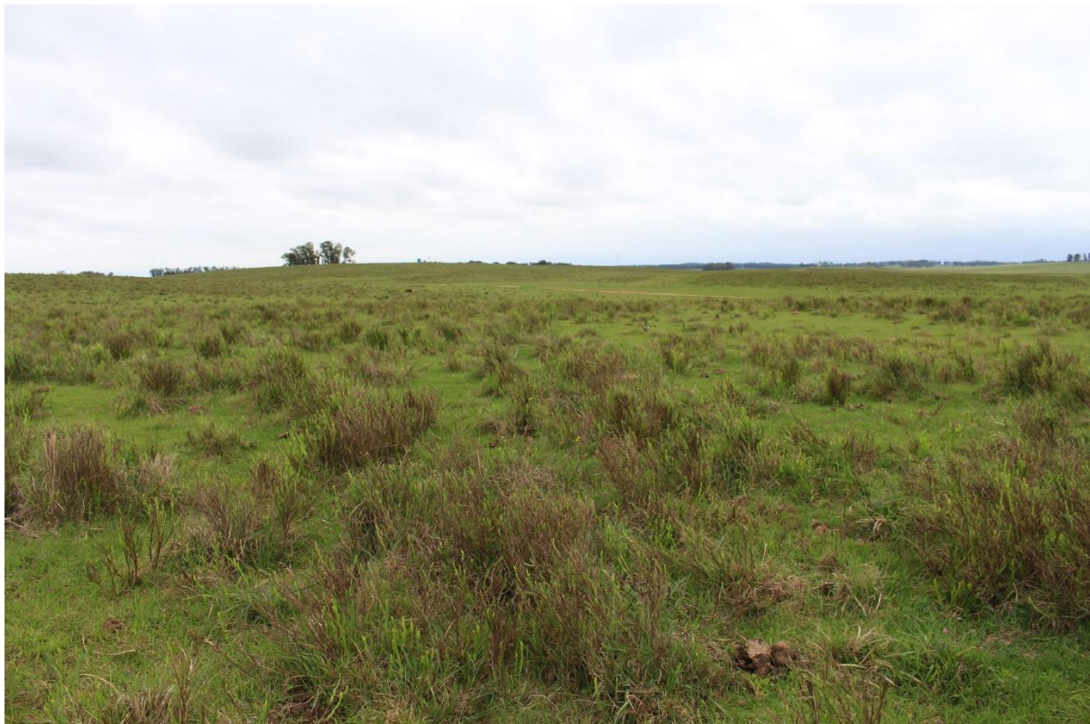
Figura 2. Exemplo de sítio “arbustivo”.