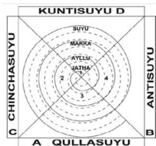
Figura 3 – Estruturas socioterritoriais aymara.

Neste ponto encontramos mais uma vez a Pacha como dupla força ou energia que junta e articula as relações da unidade doméstica. A própria ideia de gênero, a partir dessa perspectiva, forma-se não como oposição binária senão como complementaridade entre o casal. A agrupação de várias famílias ( jaqichanaka ) constituem a jatha , ou seja, a raiz da organização social aymara, onde encontramos de novo o morfema ja , desta vez junto ao morfema tha (semente) formando a jatha , ou semente com espírito: sementeira da sociedade aymara. Segundo Yampara (2015), a jatha é a unidade básica da sociedade aymara, que se compõe também como organizadora da espacialidade cósmica quádrupla aymara e que atravessa a totalidade da ordem da Pacha.