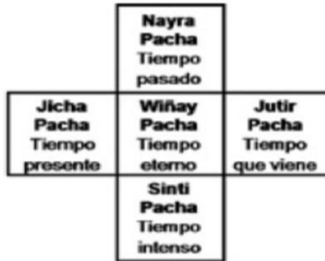
Figura 2 – Temporalidades da Pacha