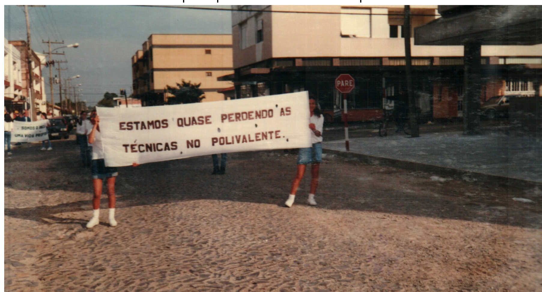
Figura 1. Desfile do 7 de setembro em 1996. Alunos carregando faixas com os dizeres “Estamos quase perdendo as técnicas do polivalente”.