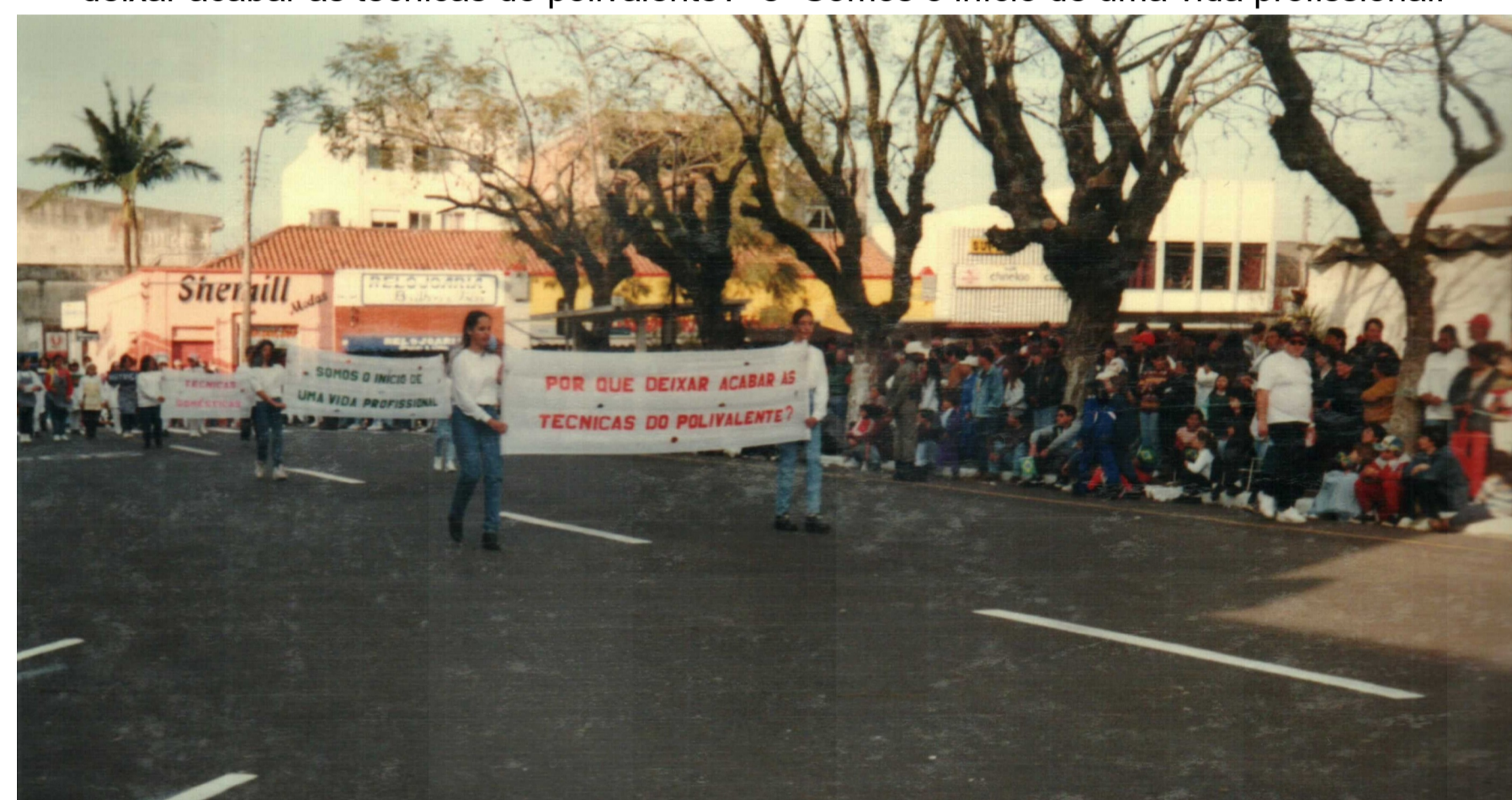
Figura 2. Desfile do 7 de setembro em 1996. Alunos carregando faixas com os dizeres “Por que deixar acabar as técnicas do polivalente?” e “Somos o início de uma vida profissional.”