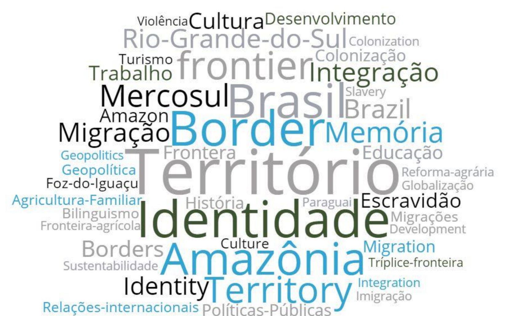
Figura 3: Nuvem das palavras mais frequentes no campo "Assunto" nas teses e dissertações (2000-2014).

Fonte: Anuário Unbral das Fronteiras Brasileiras 2016.