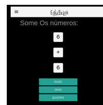
Página de jogos de numeros