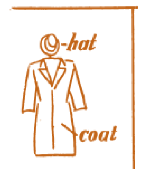
Figura 2: ilustração da margem lateral de English by the Direct Method (Jensen, [1951], p. 116).