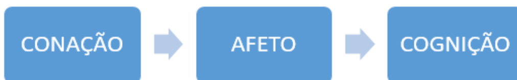
Figura 5: Sequência de Baixo Envolvimento

Fonte: Adaptado pela autora a partir de Solomon (2002)