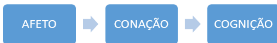
Figura 4: Sequência da Emoção