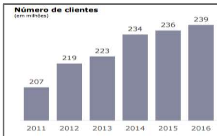
Figura 2: Número de usuários do Internet Banking