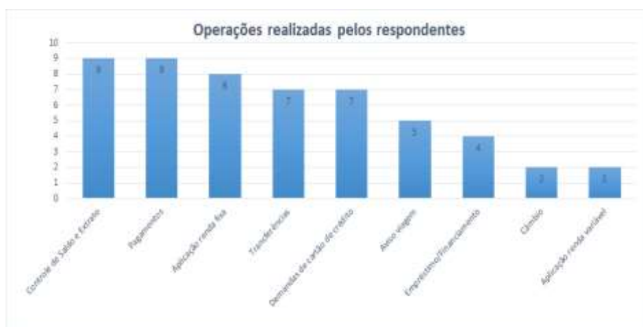
Figura 6: Principais operações realizadas no Internet Banking

A pesquisa realizada foi aplicada apenas a usuários do Internet e Mobile Banking , portanto se fez imprescindível identificar que operações eles costumam realizar com a ferramenta e quais eles são menos propensos ao uso. Dentre as operações mais usuais dos correntistas entrevistados estão: