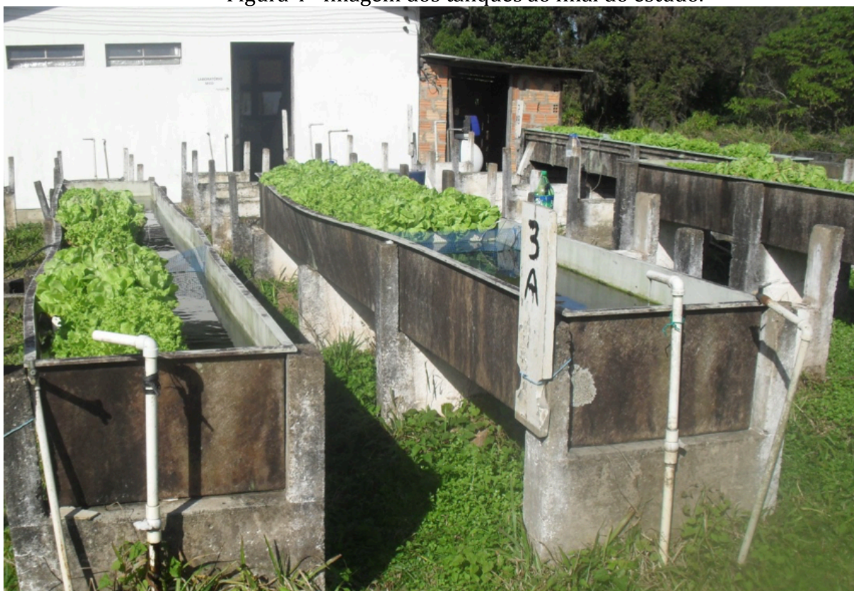
Figura 4 –Imagem dos tanques ao final do estudo.

A AquaBF elimina a necessidade de renovação de água ou o uso de um biofiltro, comum em sistemas tradicionais de aquaponia, e sem a adição de fertilizantes químicos, como usam os sistemas de hidroponia.