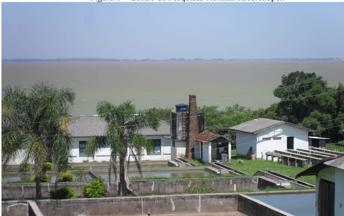
Figura 1 – Centro de Pesquisas Herman Kleerekoper.

Durante o período experimental a temperatura média foi 18,6°C, a umidade relativa do ar média 85,2% e a precipitação acumulou 300,4 mm.