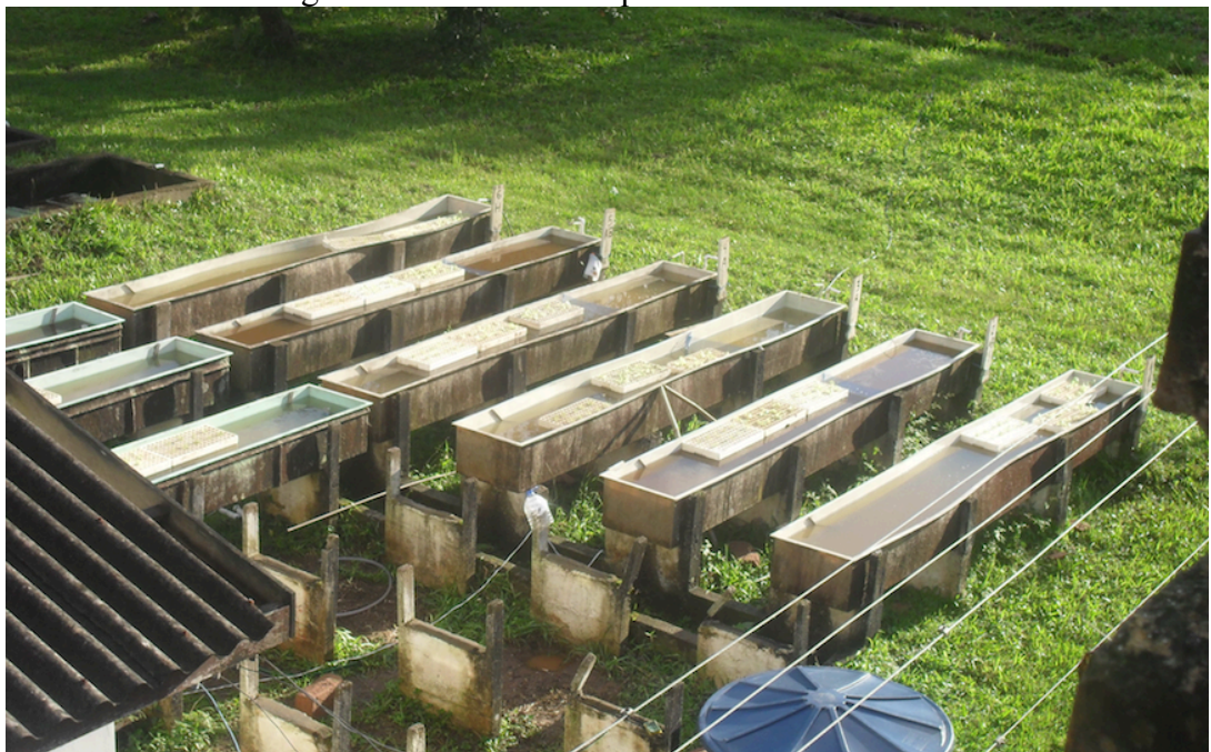
Figura 3 – Foto dos tanques utilizados no estudo.