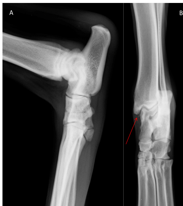
Figura 1. Imagem radiográfica do tarso direito de canino nas projeções mediolateral com a articulação flexionada (A) e dorsoplantar com a articulação estendida (B), evidenciando pequeno fragmento osteocondral junto a borda mediolateral do maléolo medial da tíbia (seta).

Ao exame físico foi observado dor em articulação tibiotársica direita (ATD), com evidente crepitação. Não foram observadas outras alterações ortopédicas neste ou nos outros membros. Foi solicitado exame