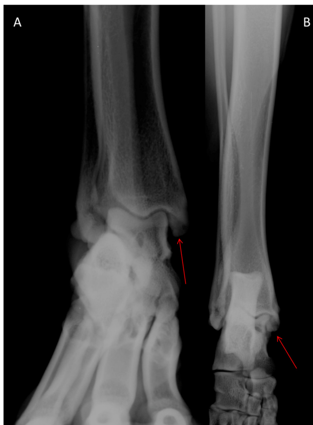
Figura 2. Imagem radiográfica do tarso direito de canino nas projeções dorsoplantar com a articulação flexionada (A) e dorsoplantar com a articulação estendida (B), evidenciando pequena irregularidade óssea subcondral na margem medial da tróclea medial e pequeno fragmento ósseo arredondado entre a tróclea e o maléolo medial (setas).