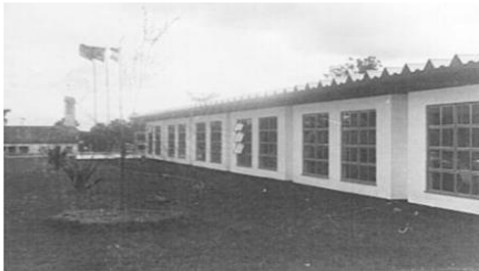
Figura 1- foto da escola Estadual de Ensino Médio Padre Réus.

Desde os primeiros contatos que fiz com os professores da Escola, observei o empenho do grupo e o zelo dos professores para com a Instituição, essas características são recorrentes nas narrativas: “nós estamos caminhando e construindo e vamos seguir aproximando a nossa escola das exigências do vestibular da UFRGS, pois a Escola Pública tem uma demanda de alunos que precisa passar na Universidade Pública e para nós isso é um compromisso muito sério” . As palavras 10 pronunciadas pelos(as) professores(as) foram confirmadas no momento em que visitei o site da Escola disponível na Internet de onde obtive os primeiros dados e algumas evidências do trabalho que é desenvolvido nesta comunidade educativa.