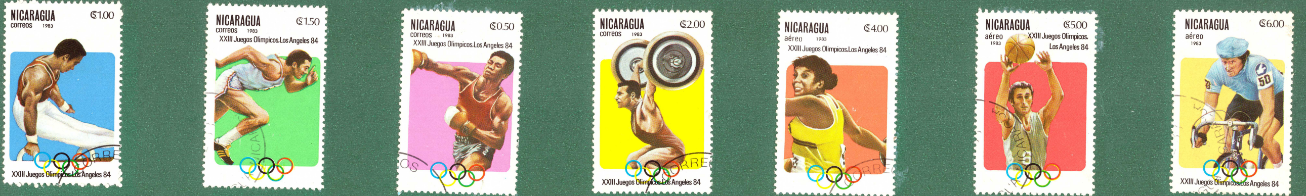
1984 - LOS ANGELES NICARAGUA