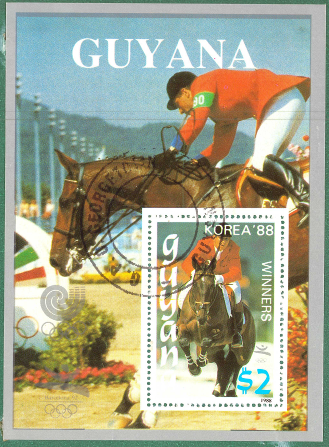
GUYANA - 1988 SEUL