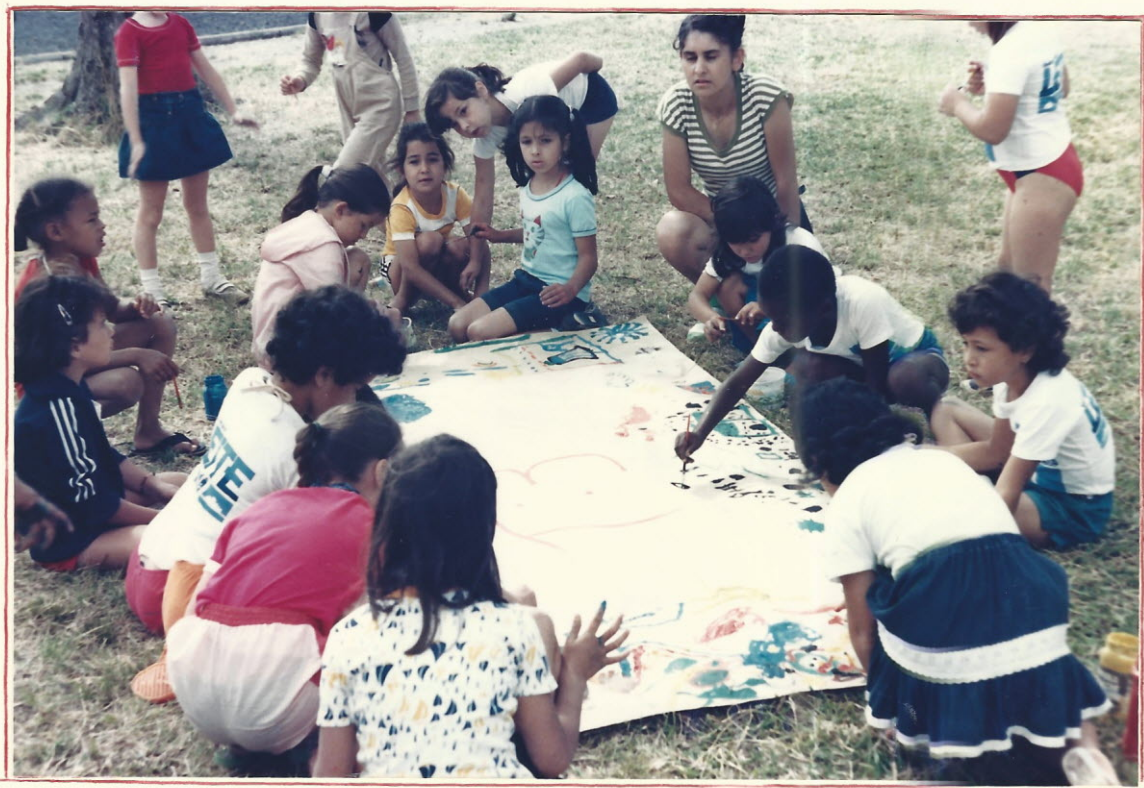
Crianças em atividade