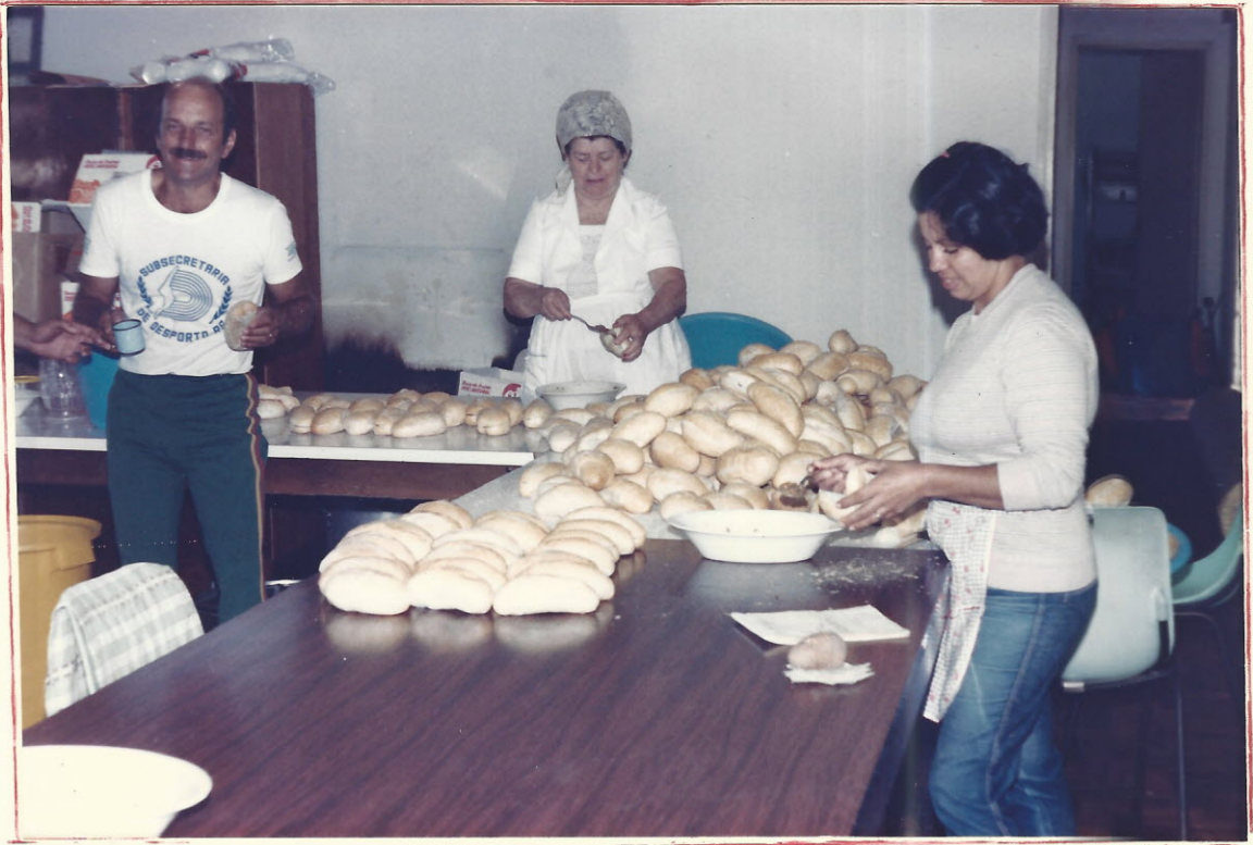
Preparação do lanche