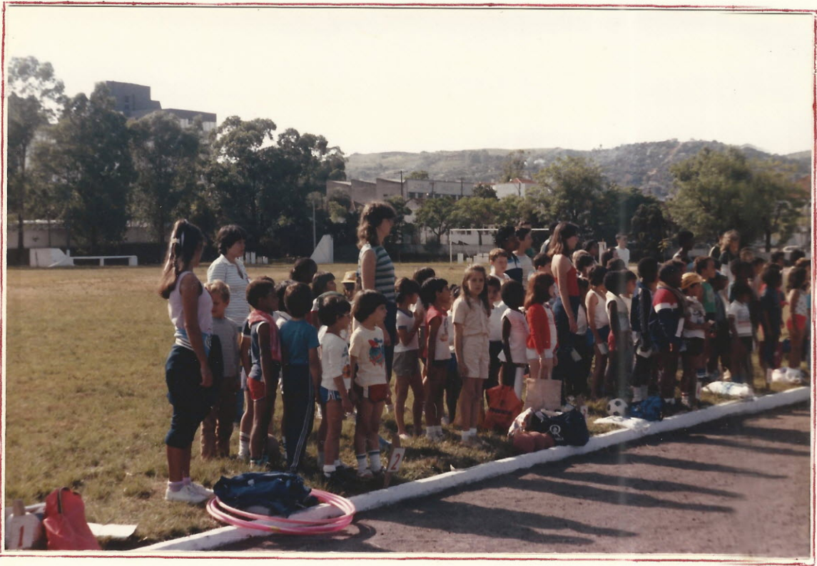
Grupos posicionados para o Canto do Hino Nacional