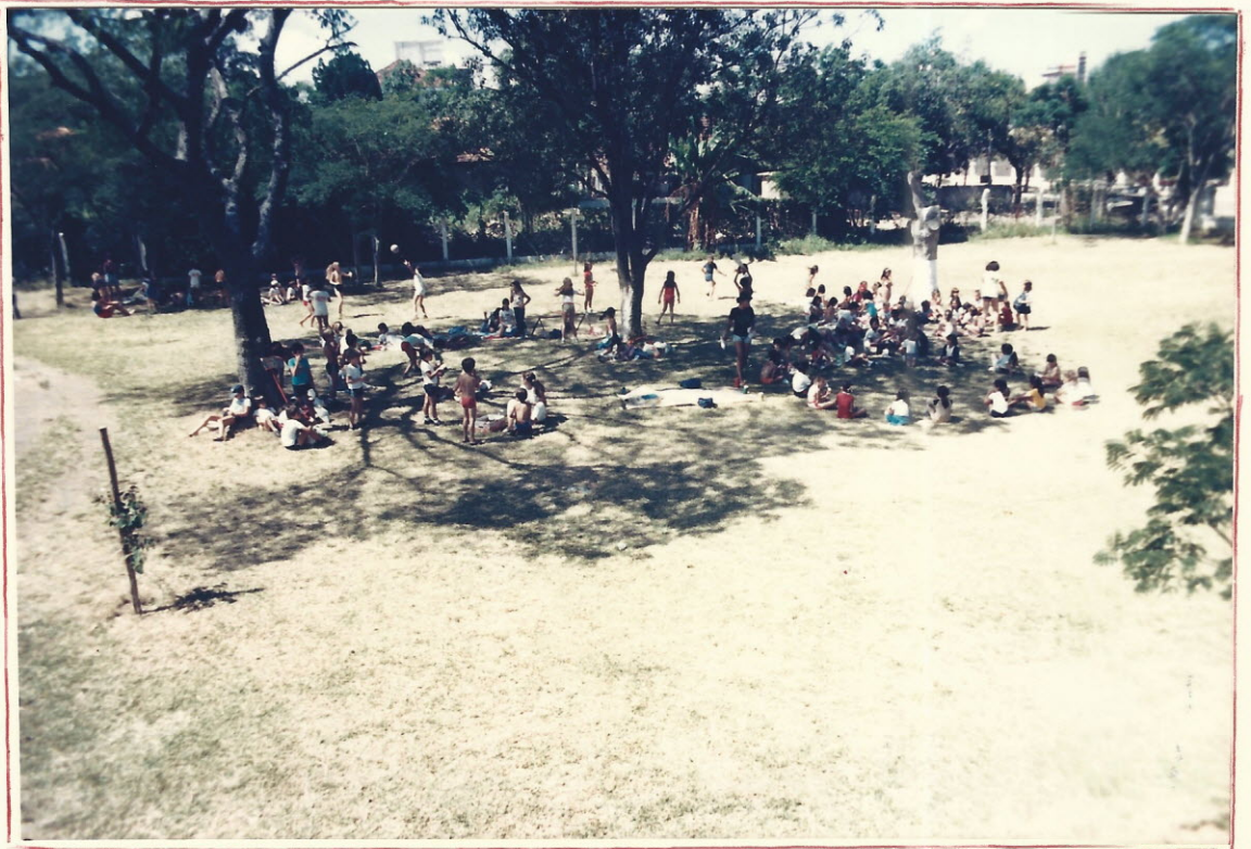
hora do lanche