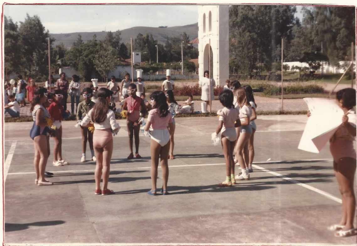
A apresentação do grupo os Gatos