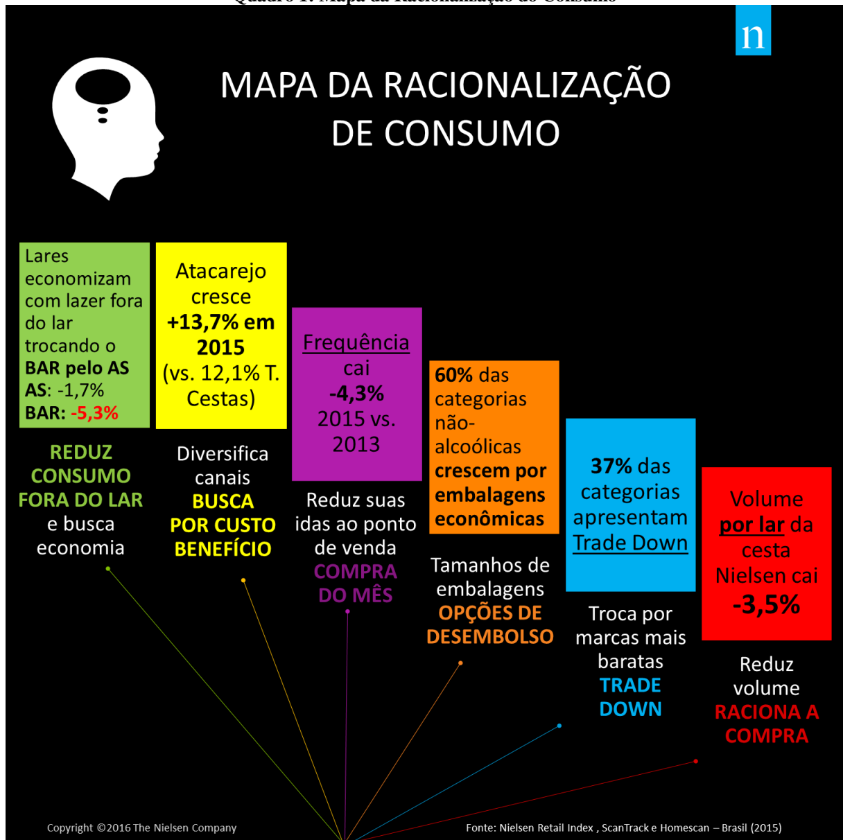
Quadro 1: Mapa da Racionalização do Consumo