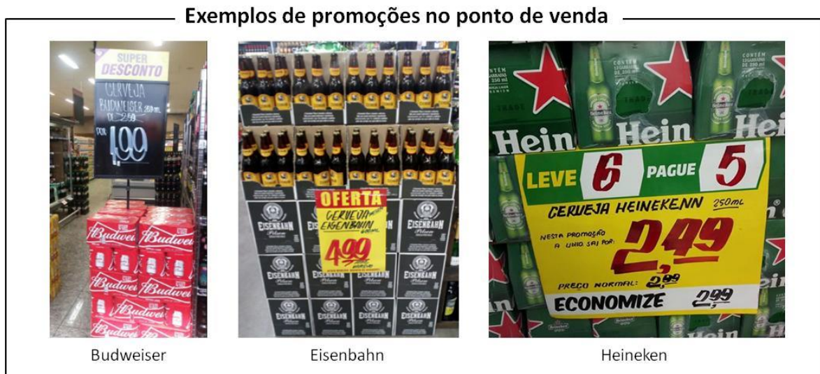
Figura 2: Exemplos de promoções no ponto de venda

Como eu te falei, vou sempre olhar o preço mesmo, porque não compro duas garrafas né, vou comprar umas doze e assim faz diferença. A gente quer beber as marcas que são melhores e tal, mas esse tipo de cerveja se toma em quantidade, então a promoção é fundamental. (ENTREVISTADO 3, 25 ANOS)