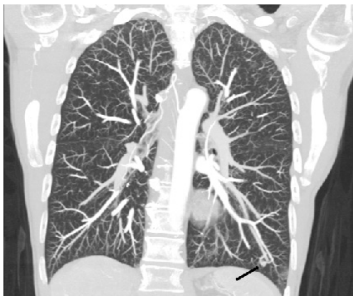
Figura 2: Tomografia computadorizada com reconstrução coronal utilizando projeção de intensidade máxima (MIP) e com janela de pulmão demonstrando malformação.