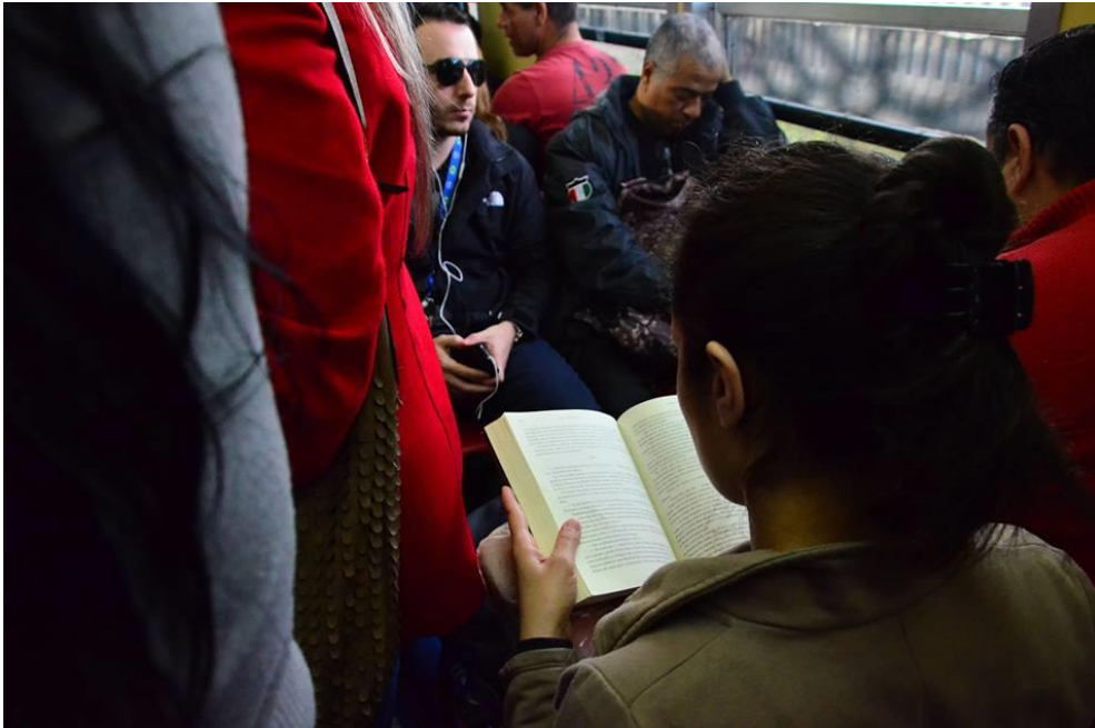
Figura 2 – Leitora em meio ao amontoado de pessoas.

ancorado num reconhecimento social (POULAIN, 1997, p. 94).