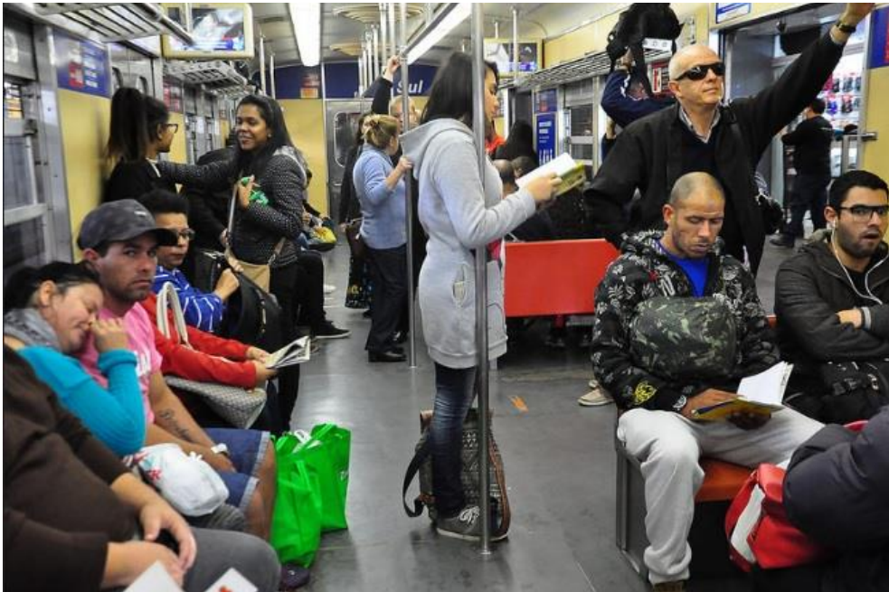
Figura 1 – Leitores sentados e em pé.