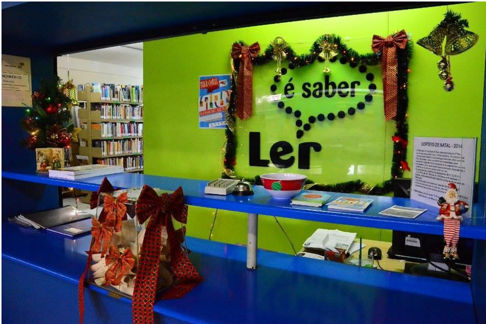
Figura 3 – Espaço Multicultural Livros sobre Trilhos