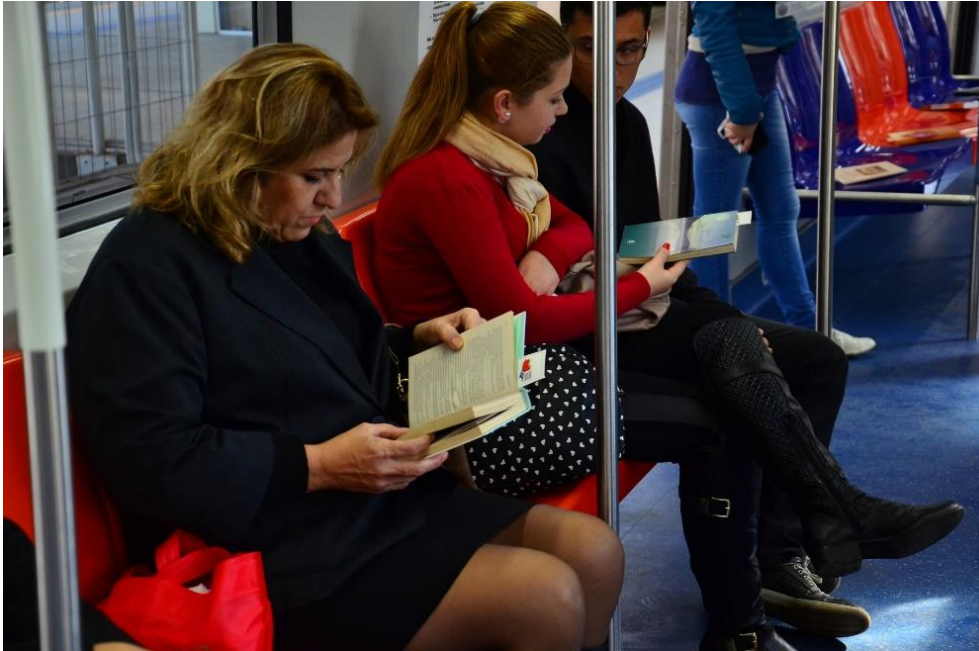
Figura 3 – Leitoras.