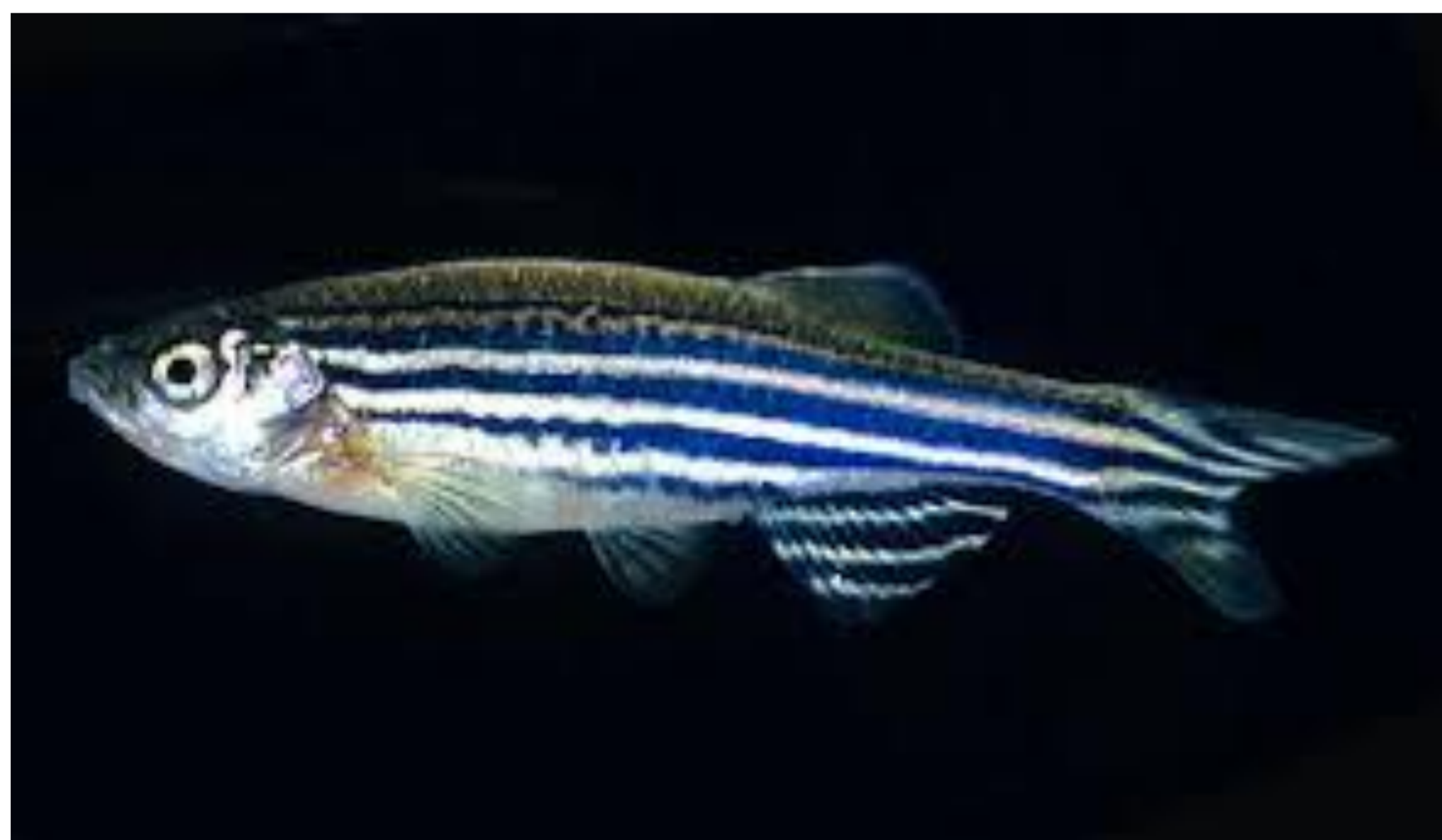
Fig. 1 : Fêmea de Danio rerio adulta

O método para avaliação da toxicidade crônica em peixes padronizado pela ABNT (ABNT NBR 15499) foi revisado recentemente (2016) e, apesar dos questionamentos levantados por Arenzon et. al (2013), foi mantida a avaliação da toxicidade com Danio rerio (Fig. 1 e Fig 2) baseada exclusivamente sobre a sobrevivência dos organismos-teste. O método consiste na exposição de larvas recém nascidas à amostra a ser avaliada, pelo período de 7 dias. Durante o ensaio os organismo não são alimentados. Segundo Uusi-Heikkilä et. al (2010), existe influência do tamanho dos reprodutores na quantidade de vitelo repassada aos ovos e conseqüentemente na condição das larvas nos primeiros dias de vida. A influência da condição das larvas na sensibilidade do método deve ser avaliada.