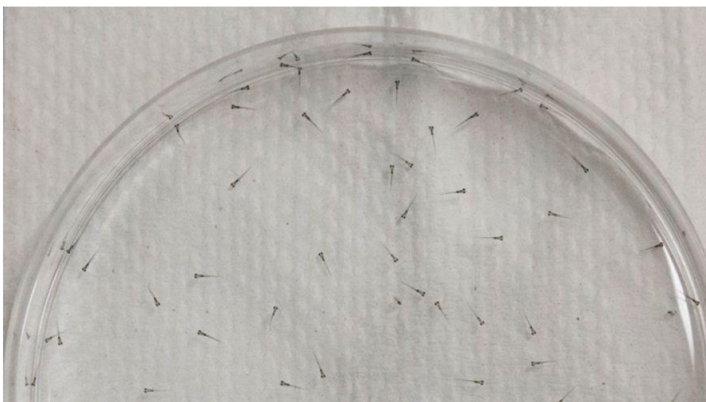
Fig. 2: Larvas de Danio rerio com até 24 horas de vida.

Implantação do método para avaliação da toxicidade crônica em peixes padronizado pela ABNT (ABNT NBR 15499) e determinação da variabilidade deste para o NaCl como substância de referencia.