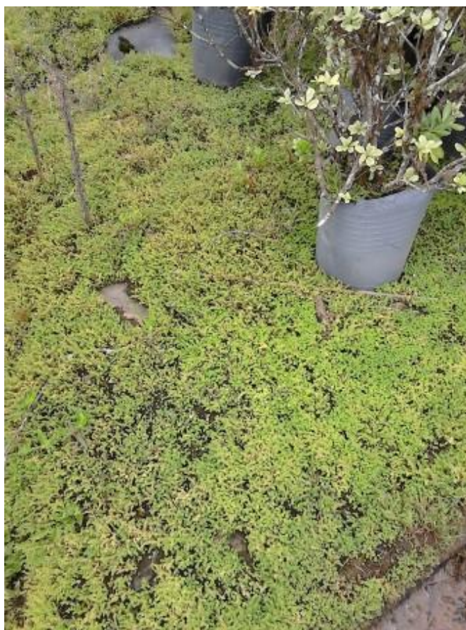
Figura 6 - Algumas espécies como Pilea microphylla são de difícil controle mesmo com a aplicação de herbicidas.

sementes presente no próprio substrato e também através da dispersão do material reprodutivo como o vento, insetos etc. As plantas espontâneas identificadas foram: Cardamine bonariensis , Pilea microphylla (Figura 6), Oxalis corniculata , Chamaesyce hirta , Ipomoea purpúrea , Phyllanthus tenellus , Amaranthus retroflexus , Portulaca oleraceae e Ageratum conyzoides .