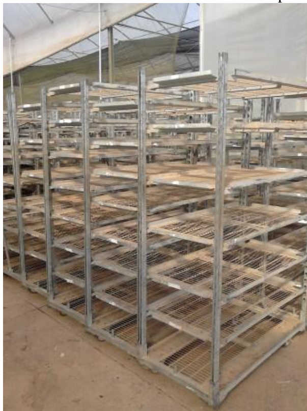
Figura 8 - Carrinhos de mão utilizados no transporte dos pedidos.

O recolhimento dos pedidos era preferencialmente realizado no turno da tarde para que os caminhões pudessem ser carregados ao final do dia.