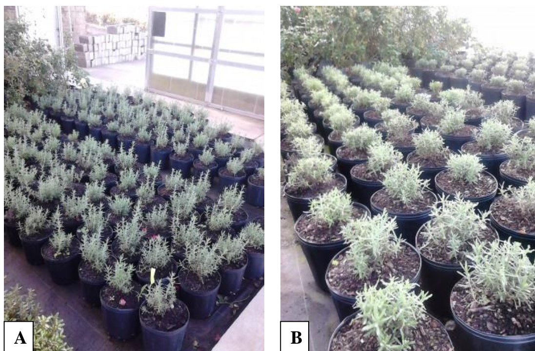
Figura 3. Detalhes da poda de formação de Lavandula angustifolia . A. Antes da poda de formação; B. Após a poda.

Semelhante ao processo da poda de formação, a poda de manutenção era realizada em plantas de maior idade com o objetivo de atrasar o desenvolvimento da planta e mantê-la em um padrão de comércio evitando um descarte precoce. Alguns exemplos de plantas podadas foram: Vinca minor , Abutilon 'Goldbach' .