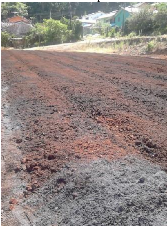
Figura 7 - Área de mistura dos componentes do substrato.

Os materiais em maior quantidade como casca de pinus, cavaco de acácia, entre outros, foram espalhados sobre o chão com ajuda de uma retroescavadeira e em seguida disponibilizados os componentes de menor quantidade (adubos e corretivos) de forma manual, por duas pessoas. Após a colocação da terra preta e vermelha foi realizada a mistura com uma enxada rotativa acoplada ao trator (Figura 7). Por fim, o material foi recolhido e acondicionado sob o galpão de armazenamento.