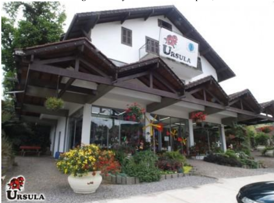
Figura 1 – Loja Matriz. Nova Petrópolis, RS