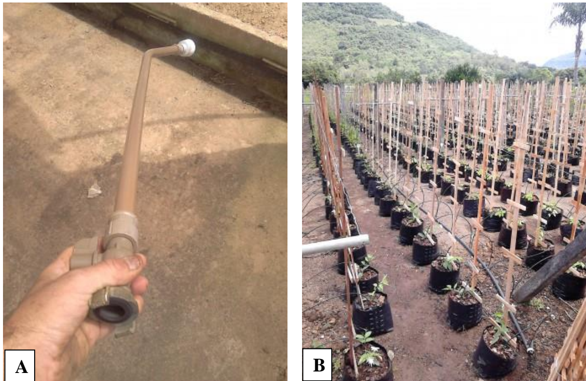
Figura 5 - A. Chuveirinho utilizado para irrigação manual; B. Irrigação por gotejamento.

A quantidade de água para as plantas levava em conta alguns sinais como a cor do substrato (substrato mais claro necessitava de mais água), quantidade de radiação solar no início da manhã (em dias de chuva ou nublados, a irrigação era realizada um pouco mais tarde) e tamanho do recipiente (vasos maiores necessitavam de maior quantidade de água). Nas espécies cultivadas a campo, a irrigação nem sempre era realizada devido à ocorrência de dias chuvosos.