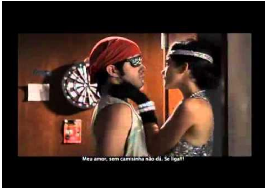
Figura 2 - Vídeo Sem camisinha não dá/Episódio 2

levem camisinha às festas de carnaval; o segundo apresenta uma adolescente negociando o uso do preservativo, no caso, o masculino, com um rapaz; e o terceiro divulga a importância da testagem de HIV no caso de quem ‘esqueceu’ a camisinha.