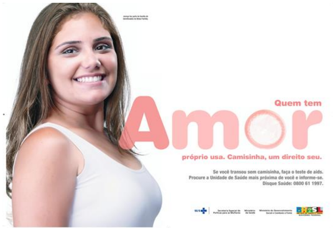
Figura 5 - Cartaz Quem tem amor próprio usa

Em 2010, o Ministério da Saúde, em parceria com o Ministério do Desenvolvimento Social e Combate à Fome (MDS), lança a campanha “Camisinha, um direito seu”, ligada ao Plano de Enfrentamento da Feminização e dirigida às beneficiárias do Bolsa Família, com o objetivo de realizar ações de prevenção às DST/aids e disponibilizar preservativos nos serviços ligados ao MDS. Abaixo, cartazes da campanha.