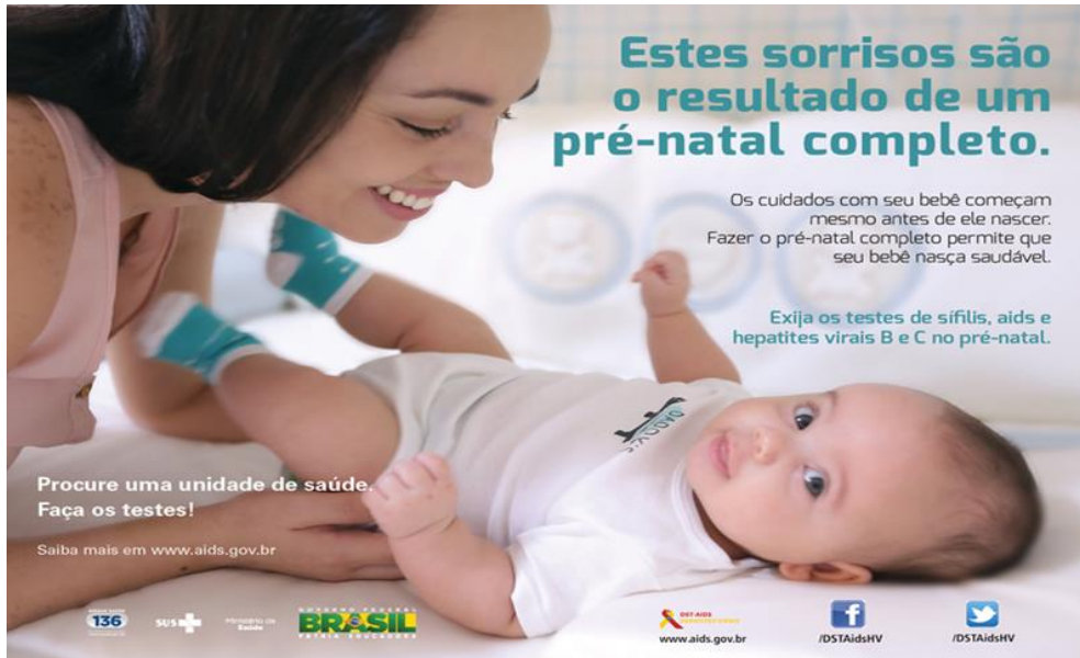
Figura 1 - Cartaz Pré-natal testagem

gestação, quando ali se diz: “Os cuidados com seu bebê começam mesmo antes de ele nascer”.