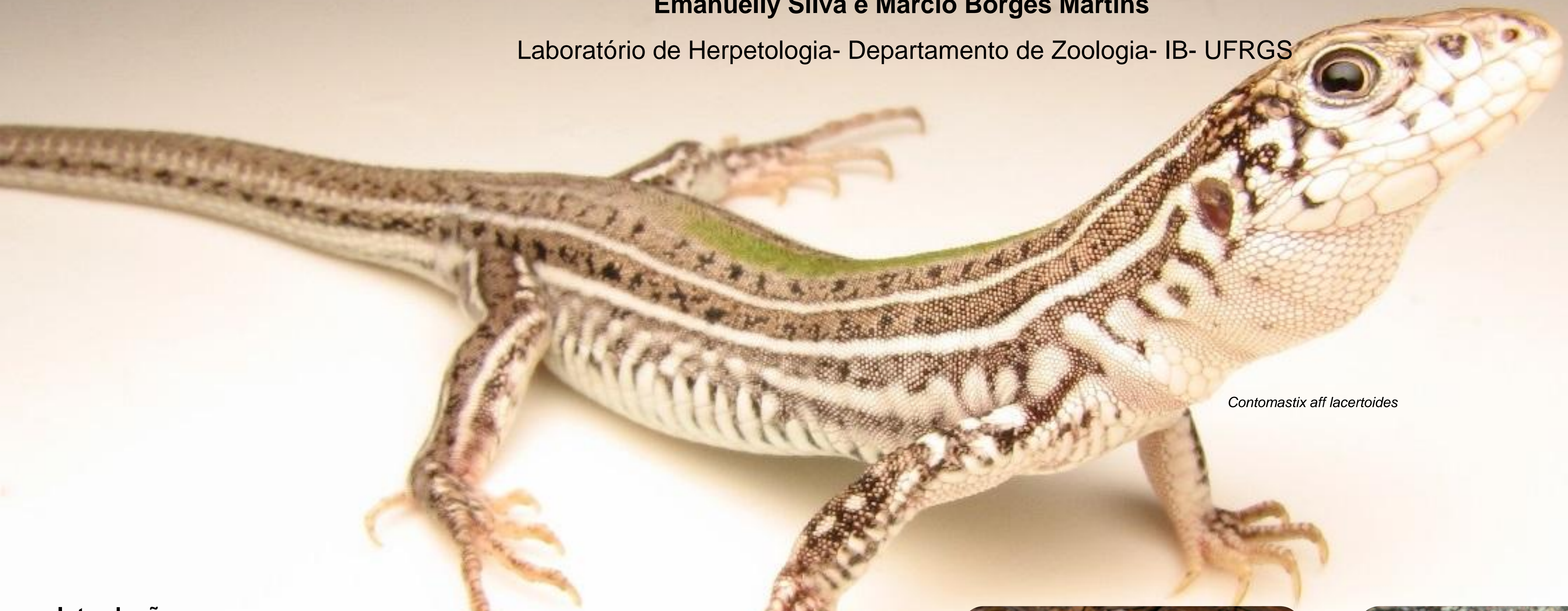
Contomastix aff lacertoides

Laboratório de Herpetologia- Departamento de Zoologia- IB- UFRGS