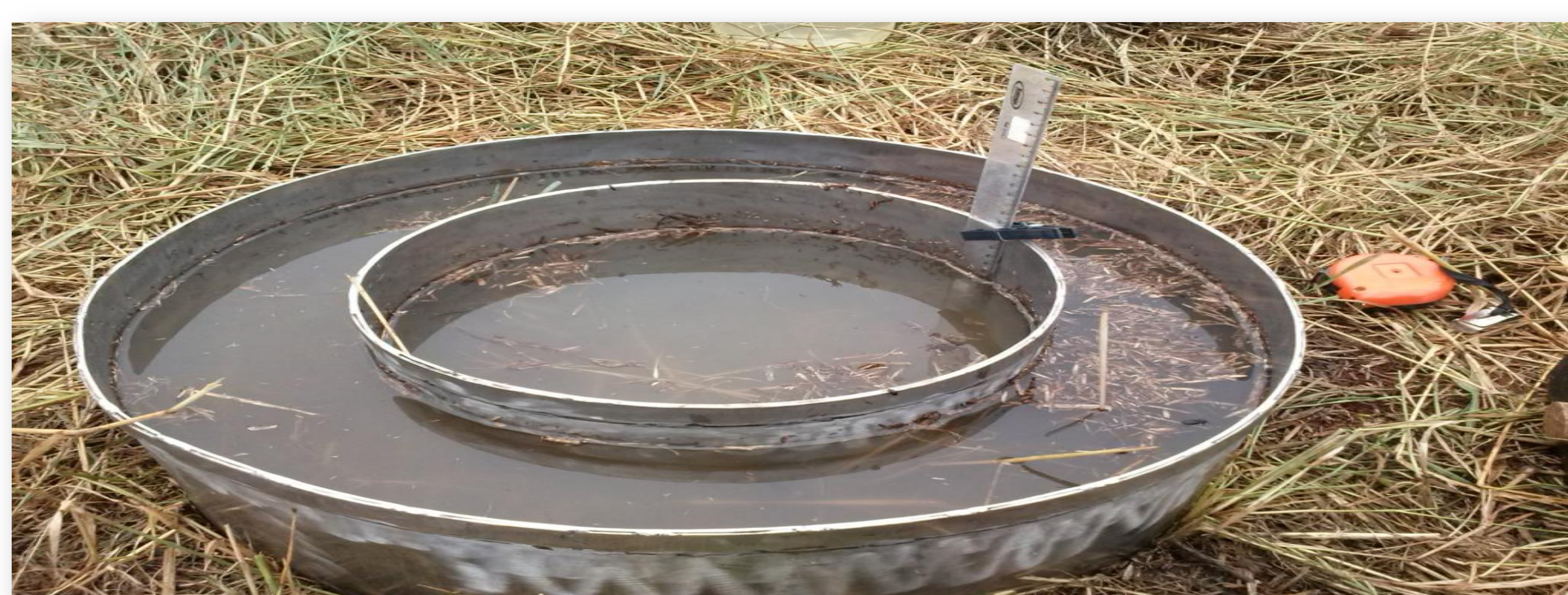
Figura 2. Infiltração de água no solo