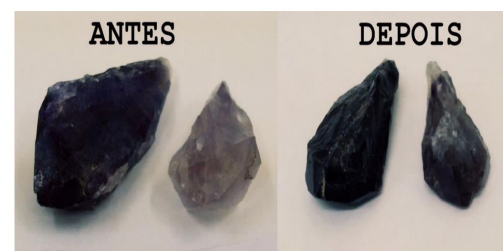
Fig 3.: Amostra da Fronteira Oeste do RS antes e depois da irradiação. Apresenta intensificação da tonalidade.