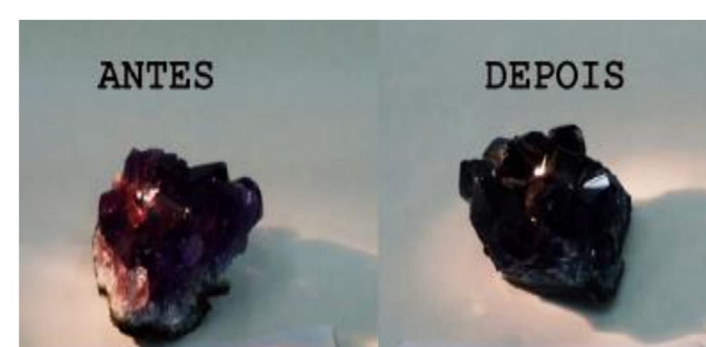
Fig 5.: Amostra de Progresso antes e depois da irradiação. Apresenta intensificação na tonalidade.