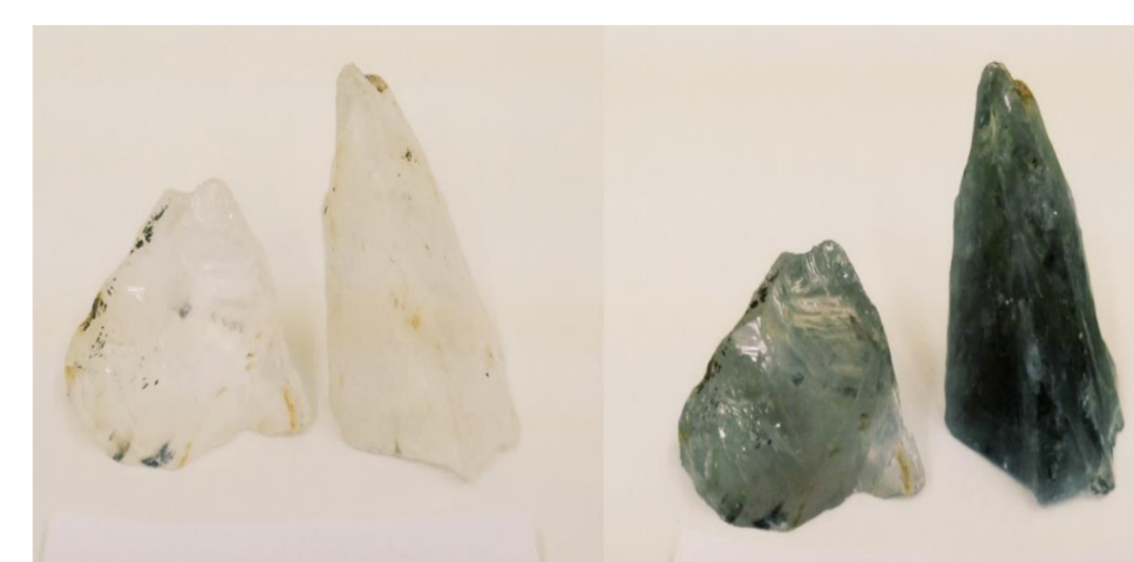
Fig 4.: Amostra de Quaraí antes e depois da irradiação. Adquiri tonalidade escura.