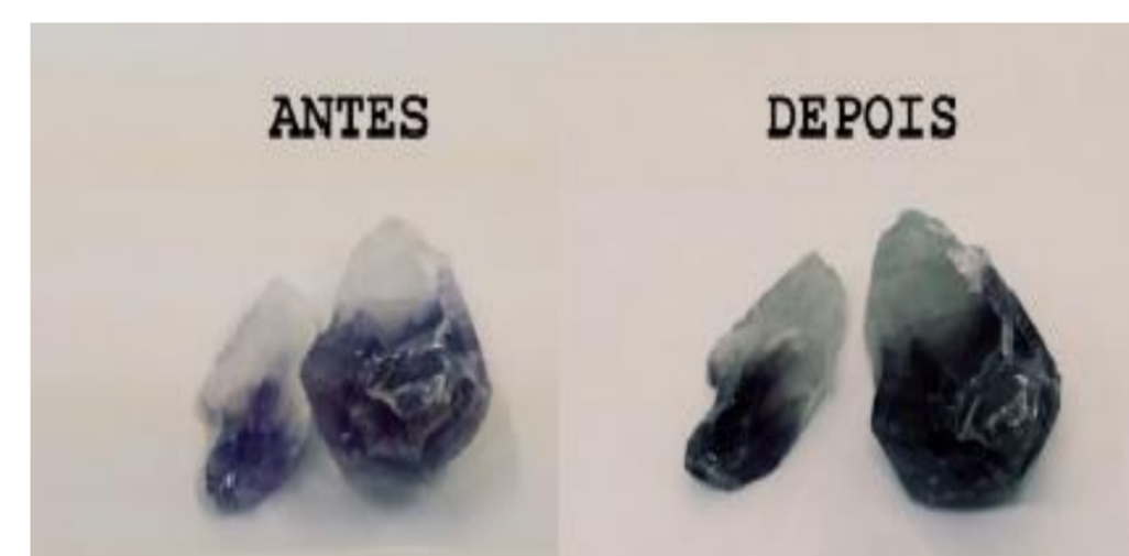
Fig 2.: Amostra de Ametista do Sul antes e depois da irradiação. Porção incolor não modifica.