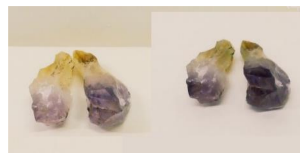
Fig 1.: Amostra de Quaraí antes e depois da irradiação. E intensificação da tonalidade.

Estudos realizados anteriormente mostraram intensificação da cor da ametista, enquanto que os incolores não modificaram, ou adquiriram o tom verde, variedade prasiolita. Os espectros de FTIR para amostras da mesma região (Enokihara, 2013), registrou as moléculas de água, hidroxila e silanol como agentes modificadores.