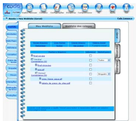
Figura 7 - Tela do Webfólio após a implementação das melhorias (Tema Aqua)

Nas funcionalidades que possibilitam a inserção de comentários, como Diário de Bordo e Webfólio , adotou-se uma sinalização que indica: 1) se existe comentário postado por formador; 2) se existe comentário postado por colega; e 3) ao formador que ele já postou comentário àquela mensagem. Além disto, e de outros pequenos ajustes que não foram citados neste artigo, também se alterou a Hierarquia de Navegação , que passou a