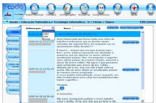
Figura 5 - Tela do Fórum após a implementação das melhorias (Tema Aqua)

Webfólio (Figura 6 e 7) – Acrescentaram-se abas que subdividem a funcionalidade em Geral , Disciplinas e Produções , separando as publicações. Além disso, o usuário configura se arquivos e pastas serão visíveis para Ninguém , Formadores ou Todos . Em Webfólio da Produção , somente o professor responsável e o administrador da produção podem apagar os arquivos da lixeira.