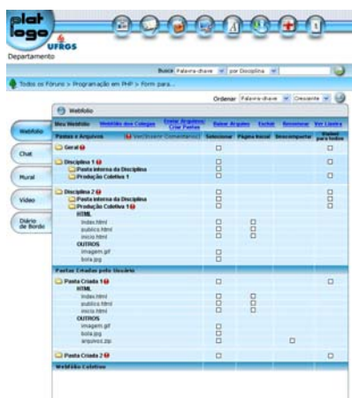
Figura 6 - Primeira versão da Tela do Webfólio, antes do aperfeiçoada (Tema Aqua)

Webfólio (Figura 6 e 7) – Acrescentaram-se abas que subdividem a funcionalidade em Geral , Disciplinas e Produções , separando as publicações. Além disso, o usuário configura se arquivos e pastas serão visíveis para Ninguém , Formadores ou Todos . Em Webfólio da Produção , somente o professor responsável e o administrador da produção podem apagar os arquivos da lixeira.