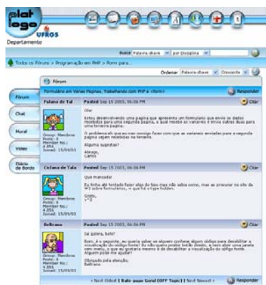
Figura 4 - Primeira versão da Tela do Fórum, antes do aperfeiçoamento (Tema Aqua)

Fórum (Figura 4 e 5) – Reorganizou-se a disponibilização de mensagens, possibilitando que o usuário escolha se deseja visualizá-las ordenadas por Árvore , Data ou Autores . Ao habilitar o Fórum para sua disciplina, o professor seleciona se a criação de tópicos poderá ser feita somente pelos formadores ou por todos. Quando o usuário posta uma mensagem, ele tem cinco minutos para editá-la ou apagá-la.