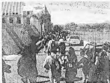
Entrada da ocupação no Conselho Nacional de Educação—Brasília 2004