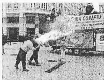
Ato público ENEEF Curitiba 2003