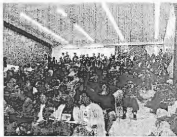
CoNEEF que definiu o Ato Público do ENEEF—Brasília 2004