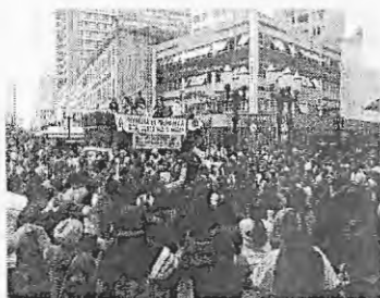
Ato Público ENEEF—Curitiba 2003