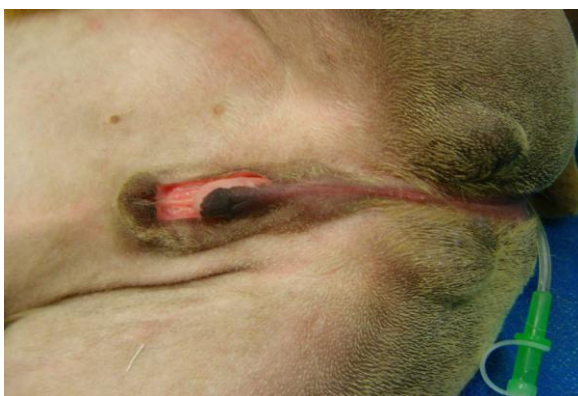
Figura 3. Vista ventral da região abdominal caudal, evidenciando o escroto dividido, o prepúcio incompleto ventralmente e o pênis com desvio ventral e subdesenvolvido.