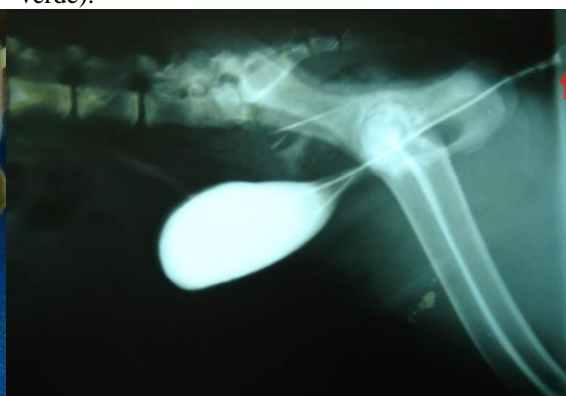
Figura 4. Uretrocistografia evidenciando o trajeto uretral anormal até a bexiga. A seta (vermelha) indica o local da cateterização da uretra na região perineal.