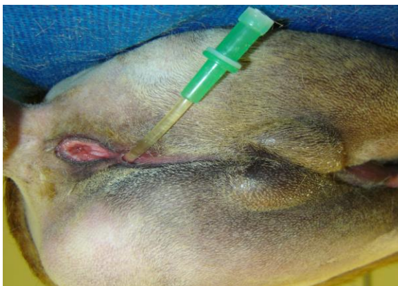
Figura 1. Vista caudal da região perineal do canino, demonstrando a passagem da sonda pelo orifício uretral, localizado ventralmente ao ânus.