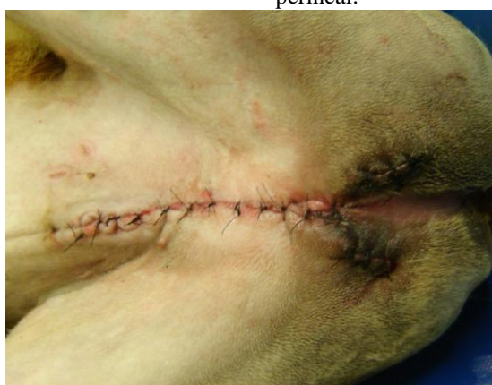
Figura 5. Vista ventral do abdômen caudal do canino após realização dos procedimentos de amputação peniana e prepuçial e de orquiectomia.