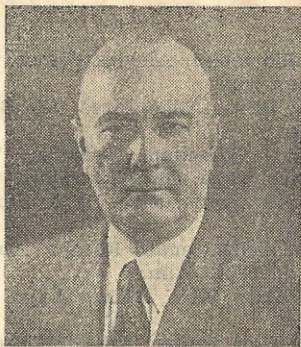
GENERAL DARCY VIGNOLI Eleito em 5.5.1944 Integra a Comissão do Jubileu de Ouro.