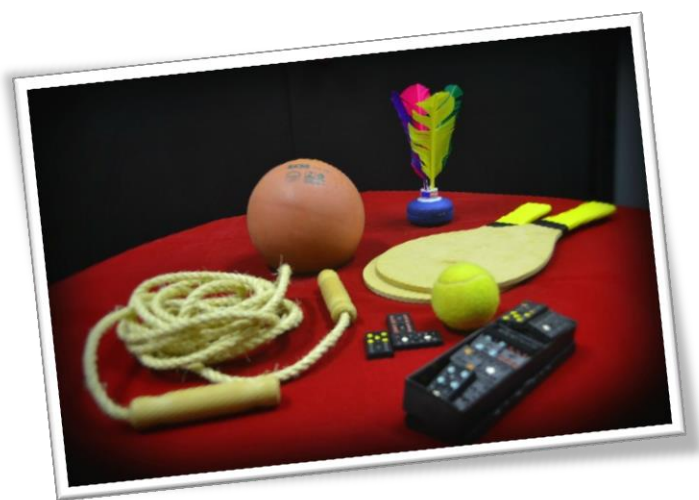
Figura1 – Acervo Tridimensional: Materiais Pedagógicos

Enfim, o acervo do Programa Segundo Tempo que está sob a guarda do Centro de Memória está constantemente em ampliação em função da sua abrangência e importância como um programa social voltado para a educação de crianças e jovens. Entendemos ainda que para mantermos a continuidade e a manutenção da coleção Programa Segundo Tempo dentro do acervo do CEME é necessário o esforço contínuo da equipe do Projeto Memórias do Programa Segundo Tempo no sentido de sensibilizar gestores, coordenadores, monitores e participantes do programa para que registrem os fatos vivenciados e as atividades que realizam. E ao fazê-lo que encaminhem esses registros para que sejam catalogados, preservados e divulgados. Dessa forma temos certeza que o CEME poderá contribuir, mesmo que de forma embrionária, para a consolidação da história e memória do Programa Segundo Tempo cujo acervo poderá ser consultado in loco ou on line por quem desejar conhecer sobre possibilidade de construir políticas públicas de esporte e lazer.