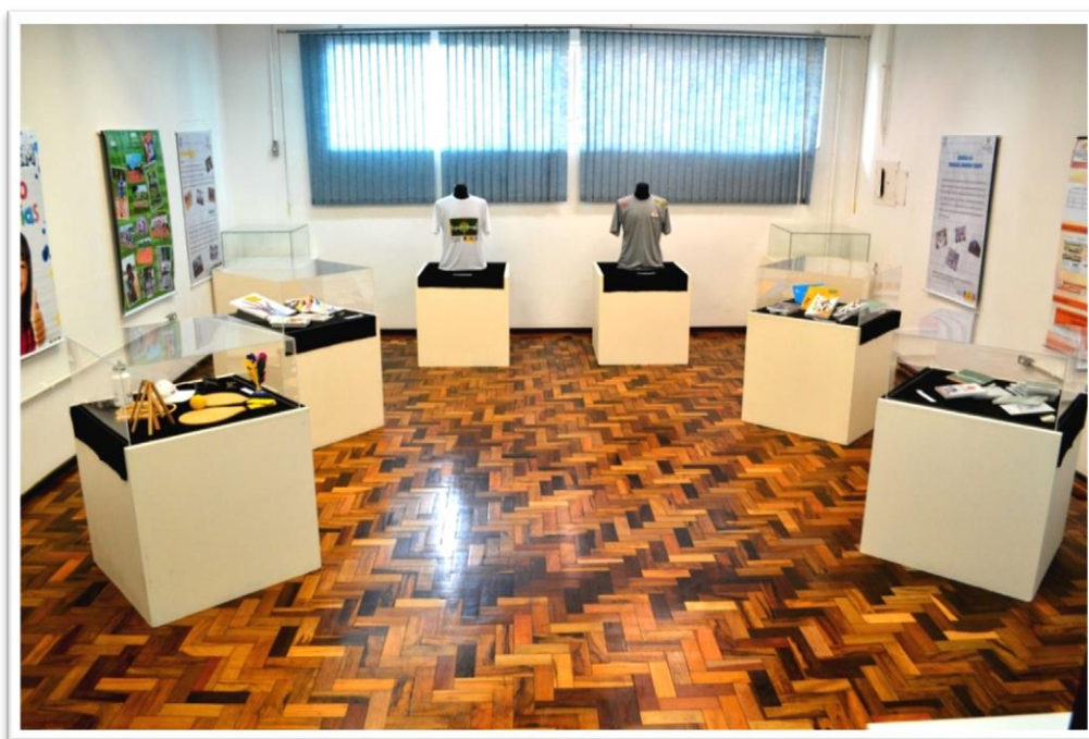
Figura 3 - Exposição 10 anos de Programa Segundo Tempo (2014)