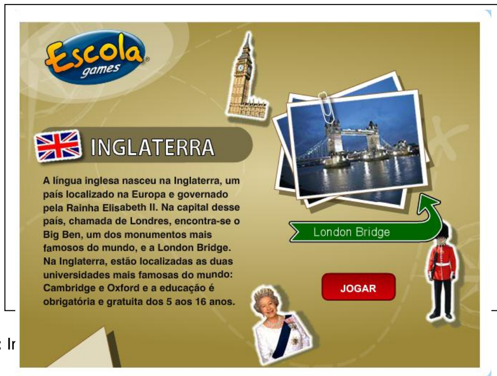
Figura 2: Ir