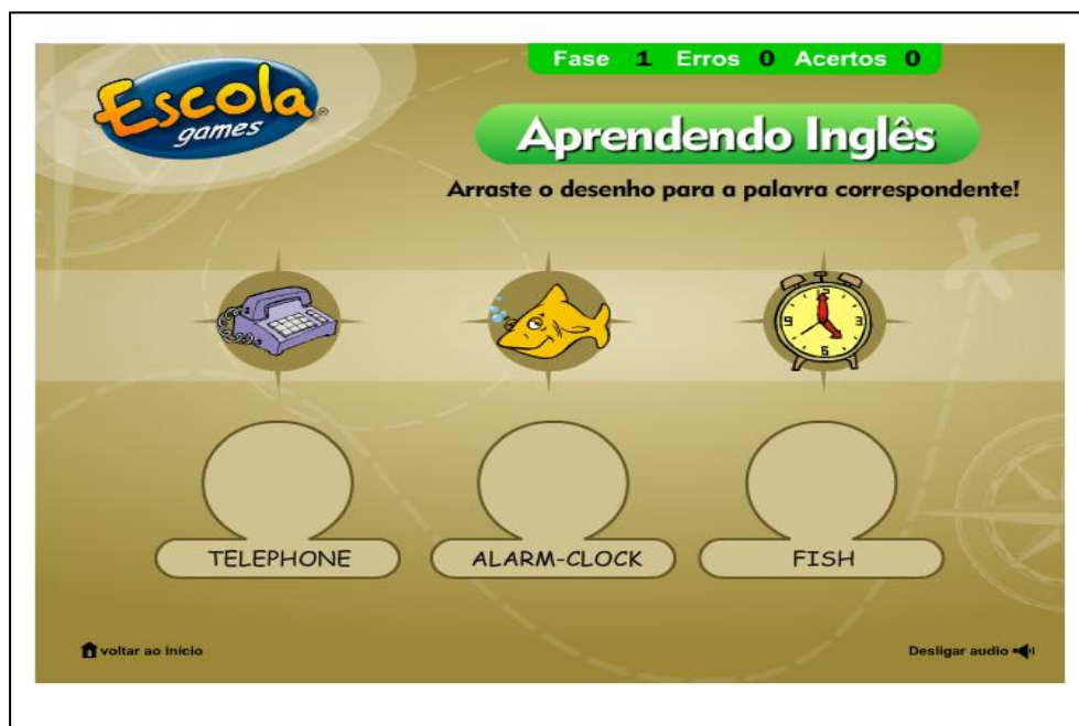
Figura 3: Tela do jogo on-line para o ensino de língua inglesa.