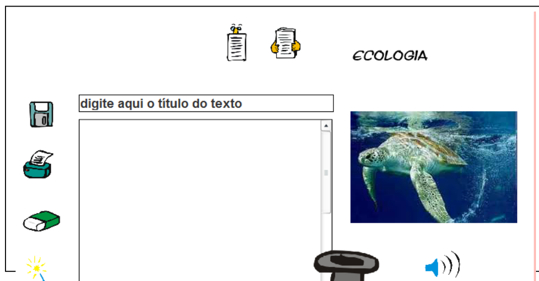
Figura 1: Interface do objeto de aprendizagem Cartola.

Este, como os demais jogos que trazemos para a nossa prática pedagógica na sala de aula, com os mais diversos intuitos que cruzam ou podem cruzar o planejamento do alcance dos objetivos para aquela turma de alunos naquele momento, exige planejamento e organização, pois o jogo não se faz nem ao menos ensina sozinho, ele necessita de estratégias de interação.