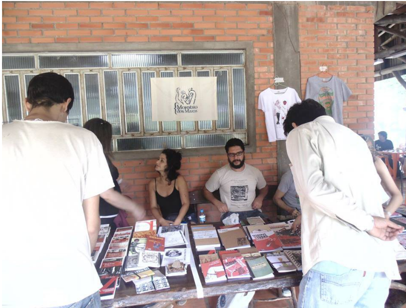
Figura 8 – Monstro dos Mares no III Encontro por uma Educação Libertária