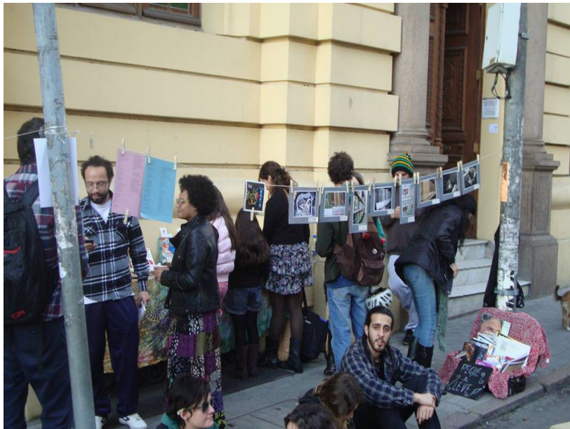
Figura 2 – Pessoas trocando livros

A figura 2 apresenta algumas pessoas realizando a troca de livros no espaço do Troca Viva. Mostra também a exposição fotográfica organizada pelas bibliotecárias responsáveis pelo coletivo.