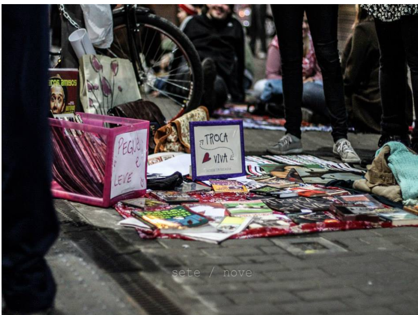
Figura 4 – Largo Vivo

As demais observações ocorreram em eventos intitulados “Largo Vivo”, que ocorrem uma vez por mês, e no qual a população compartilha um espaço público – normalmente o Largo Glênio Peres no centro de Porto Alegre – que normalmente é uma área ocupada por carros, para a realização de piquenique, apresentações artísticas, troca de ideias, etc. E no qual ocorre a mesma interação apresentada no evento anterior, entretanto, com maior participação do público, uma vez que o coletivo se mostra mais popular e ganha uma visibilidade maior.