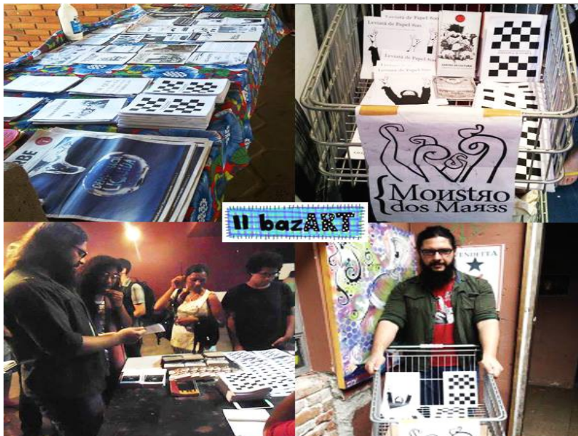
Figura 9 – Imagem de divulgação para o encontro