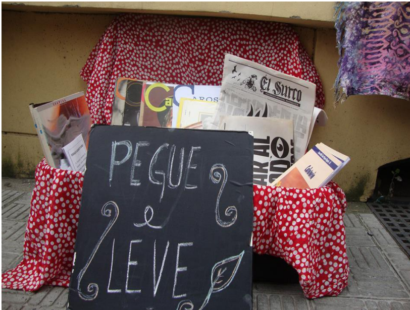
Figura 3 – Pegue e Leve