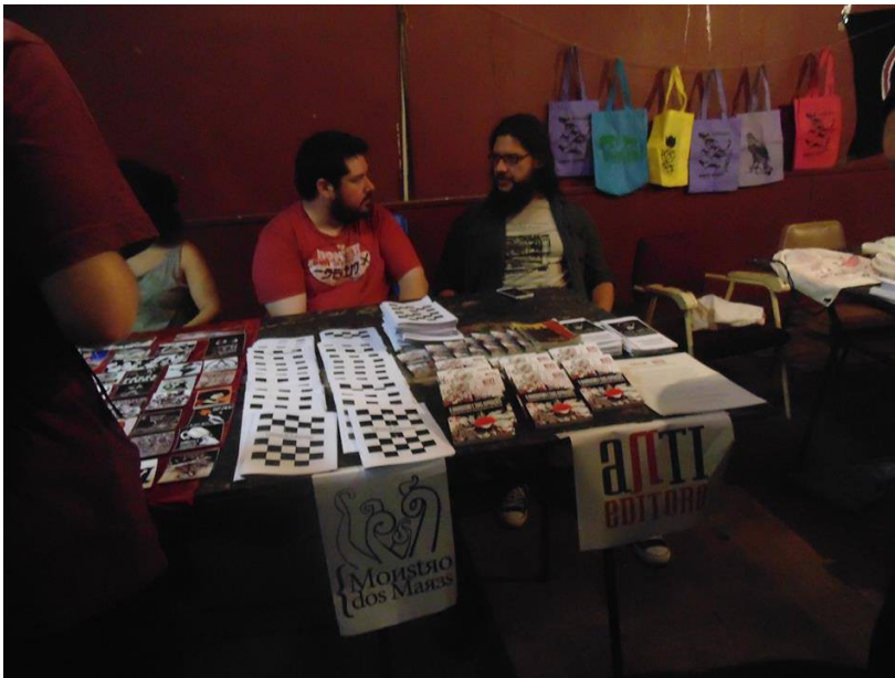
Figura 6 – Feira do Livro Anarquista no Clube de Cultura em 2013

A figura 6 apresenta a banca da editora Monstro dos Mares na Feira do Livro Anarquista de Porto Alegre no primeiro dia de evento. Muita gente circulou pelo espaço e o trabalho da editora, iniciado há pouco, começou a ser difundido no meio libertário.