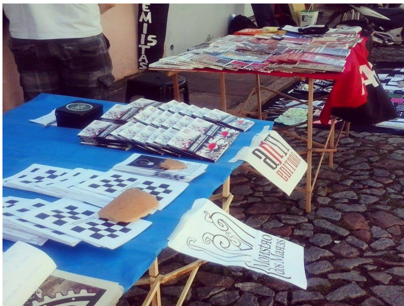
Figura 7 – Banca da Monstro dos Mares na Travessa dos Venezianos

e livros. Inclusive, uma senhora fez o questionamento para o bibliotecário deste estudo: " – Então quer dizer que anarquia não é só bagunça?", ao qual foi respondida prontamente e convidada a conhecer e interagir mais com seu trabalho.