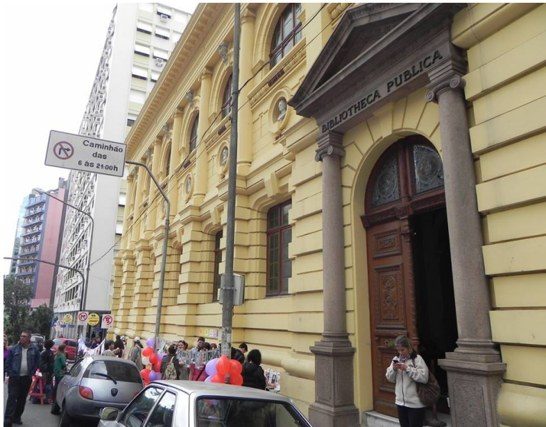
Figura 1 – Troca Viva no Rua Literária 2013