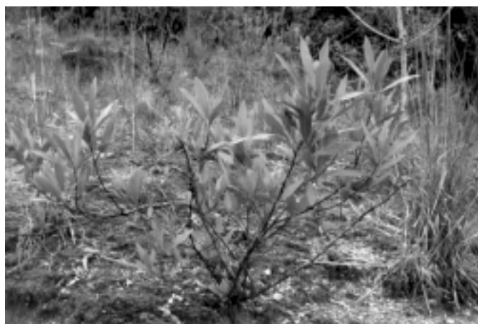
Fig. 1. Dodonea viscosa (vassoura-vermelha), em setembro, Porto Alegre, RS.