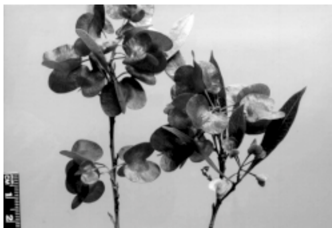
Fig. 2. Frutos de Dodonea viscosa , em setembro, Porto Alegre, RS.

1989, Mors et al. 2000, Pesman & Ervin 2002) que não foram associados com intoxicação em animais domésticos.