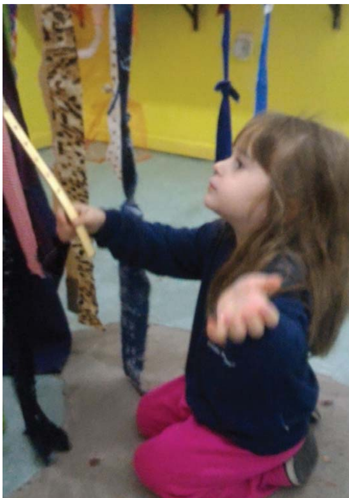
Figura 8 – É um cinto.