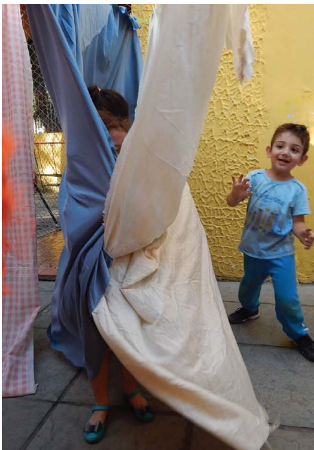
Figura 2 – Escondidas na floresta.

Em consonância com as análises compartilhadas sobre as performances de fazer de conta das crianças, consideramos oportuno apresentar a seguir outro episódio vivenciado durante as observações em campo com as crianças.