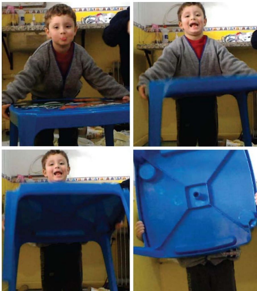
Figura 6 – Desmontando a casa.

Esse corpo compartilhado (Icle, 2013), em outros contextos, poderia ser visto como um corpo desobediente e desafiador. Todavia, em nossa perspectiva analítica, a desobediência não tem uma conotação pejorativa, mas está relacionada aos modos de expressão criativos das crianças, os quais possibilitam “atos poéticos rebeldes” (Almeida, 2019, p. 138), como será possível acompanhar nas cenas da Figura 6.