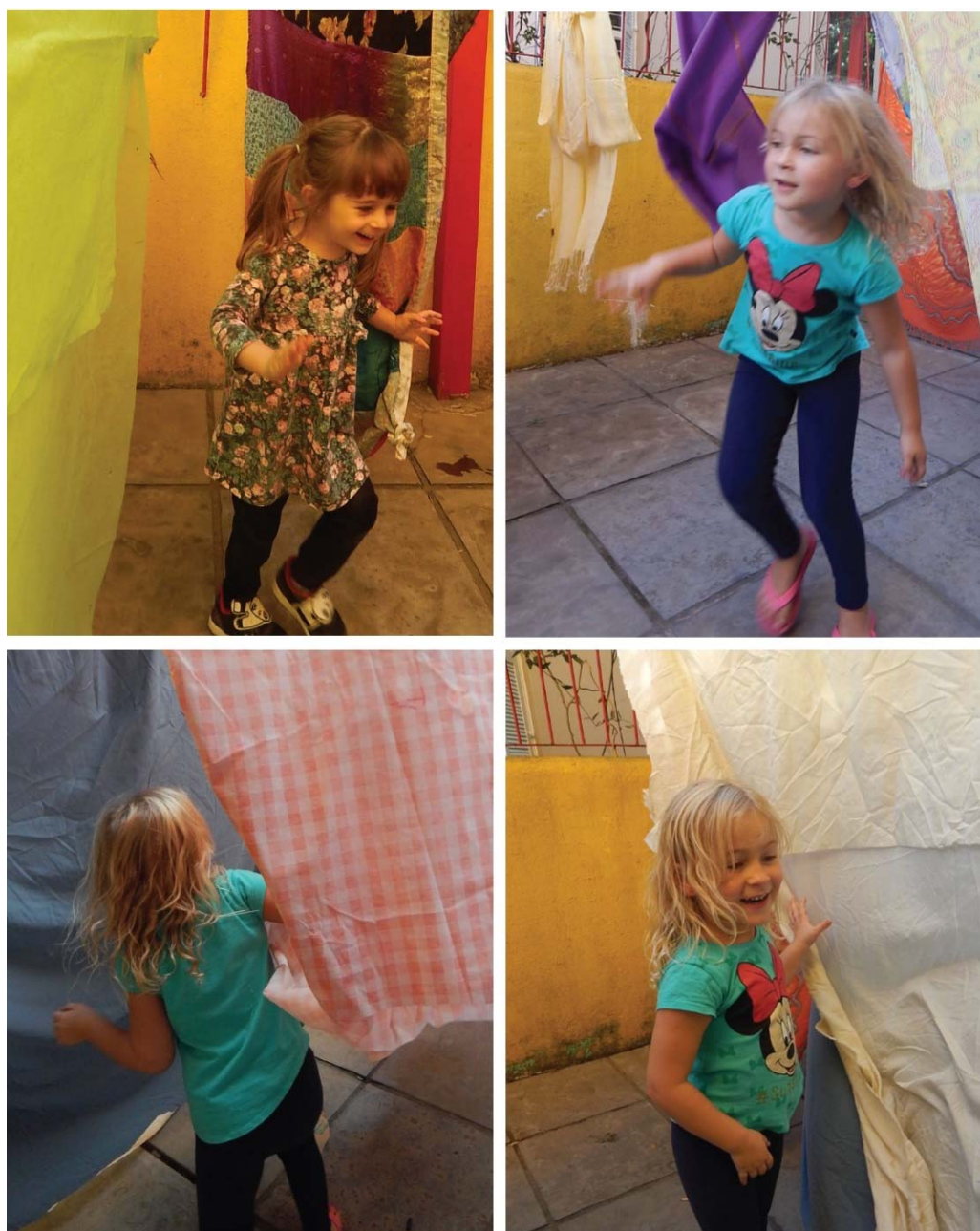
Figura 1 – Fugindo do monstro.