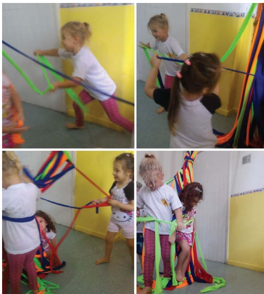
Figura 3 – A ligação.

As performances de fazer de conta protagonizadas pelas crianças evidenciam uma indissociabilidade entre corpo e oralidade. O movimento do grupo pelo espaço opera no desenvolvimento do enredo. Nos diálogos, as estratégias de alteração do volume da voz, o alongamento das sílabas das palavras e o modo enfático de emissão do tom de voz se tornam ações contínuas nas performances das crianças. Em vista do exposto, compartilhamos, nas Figuras 3 e 4, registros fotográficos que demonstram o envolvimento corporal das crianças na brincadeira.