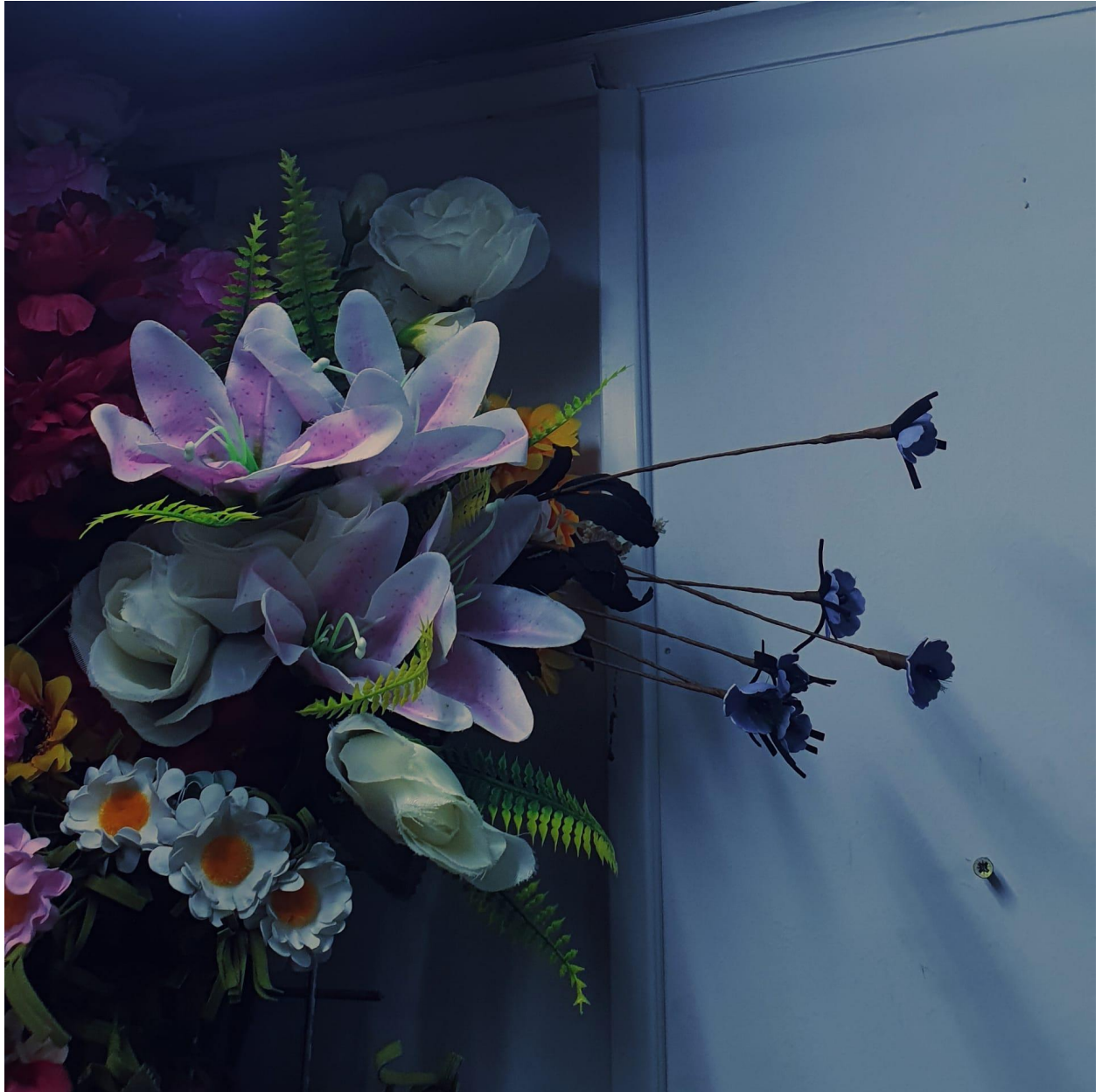
Capa do EP1, por Manuela Falcão.