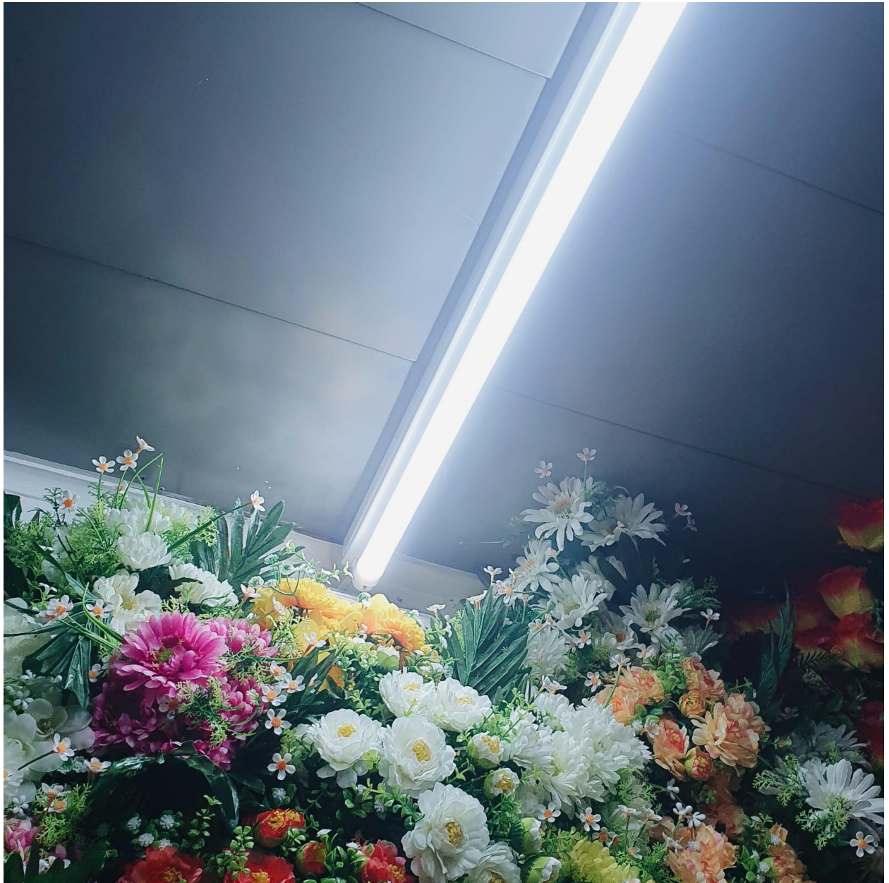
Capa do EP3, por Manuela Falcão.