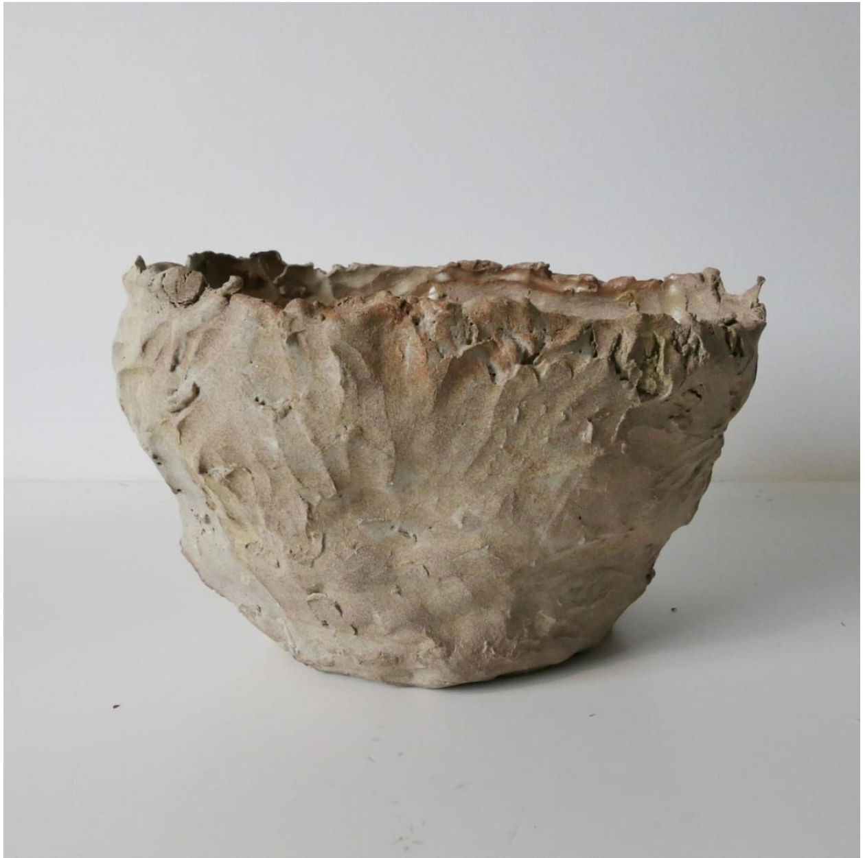
Capa do EP2, por Manuela Falcão.