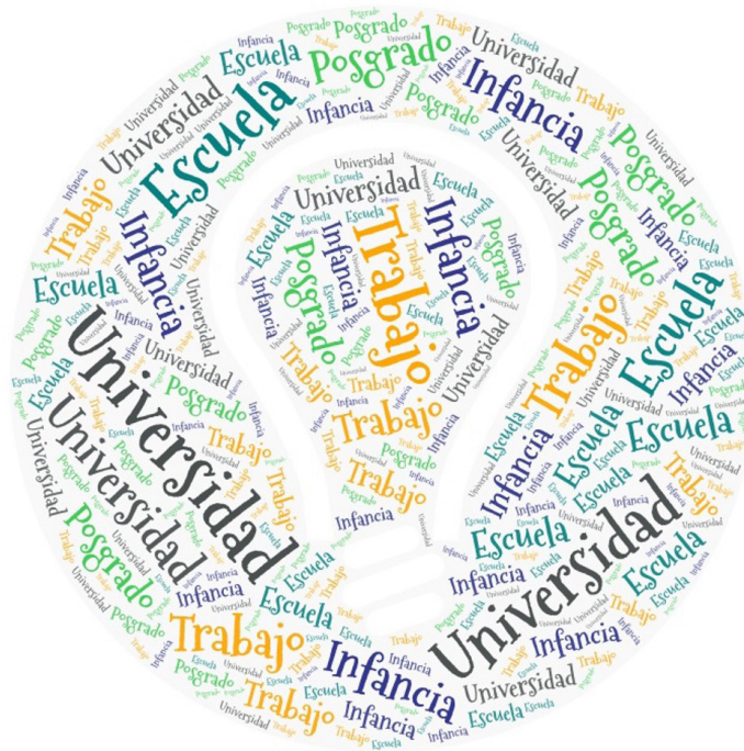
Figura 2. Primer contacto con prevención de desastres