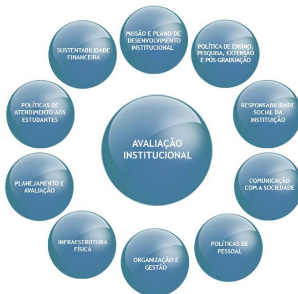
Figura 1 – Dez dimensões de avaliação do SINAES

Para tanto, foram estabelecidas pelo SINAES, dez dimensões a serem avaliadas, conforme podemos observar na imagem a seguir. A imagem, representando as dimensões de forma circular, num mesmo nível de importância, expressa a ideia de que não há hierarquia entre as dimensões. Cada uma delas, é igualmente importante para a qualidade da educação e todas elas reunidas, formam um conjunto do que se deseja alcançar. As dimensões abarcam diferentes indicadores, na tentativa de verificar com certa profundidade se atingem ou não a qualidade esperada.