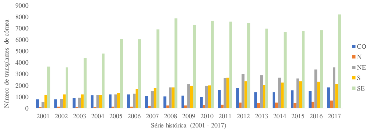
Fig 1 Série histórica do número de transplantes de córnea realizados no Brasil entre 2001 e 2017, nas seguintes regiões: centro oeste (CO); norte (N); nordeste (NE); sul (S) e sudeste (SE). Figura elaborada pela autora a partir de dados disponibilizados no site do Ministério da Saúde, Brasil

O Rio Grande do Sul teve o maior número de transplantes realizados entre os anos 2011 e 2012, 918 e 882 transplantes de córnea, respectivamente (Fig. 2). Desde então, não tem mais atingido o número de transplantes realizados nos anos citados, sendo em 2017 realizados somente 699 transplantes, um pequeno aumento se comparado ao ano anterior, porém 2016 teve o menor número de transplantes de córnea dos últimos 6 anos.