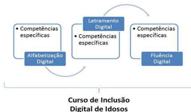
FIGURA 1 – Competências digitais para cursos de inclusão digital de idosos

O referido curso, ofertado de forma gratuita, teve por objetivo o uso do computador e suas ferramentas com a finalidade de desenvolver e/ou aprimorar três grupos de competências: Alfabetização digital, Letramento digital, Fluência digital (Figura 1). Cada conjunto possuía outras competências específicas.