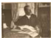
Retrato de Pedro Weingärtner em Lisboa, Portugal e data ignorada.

Esta investigação, em nível de Estágio Doutoral Sênior (pós-doutorado), foi realizada com o apoio da CAPES – Coordenação de Aperfeiçoamento de Pessoal de Nível Superior – Brasil. Ele teve por objeto o artista brasileiro Pedro Weingärtner (1853-1929), suas relações com Portugal e, principalmente, com o movimento intitulado Naturalismo. Partimos da evidência da estadia de Weingärtner em Portugal, durante o ano de 1909, principalmente na região do Minho, e investigamos como ele se relacionou com a arte portuguesa de seu tempo, seus artistas e escritores. Com isso estamos contribuindo para o conhecimento da vida e da obra do artista e também das profícuas relações entre artistas portugueses e brasileiros na segunda metade do século XIX e nas primeiras décadas do século XX.