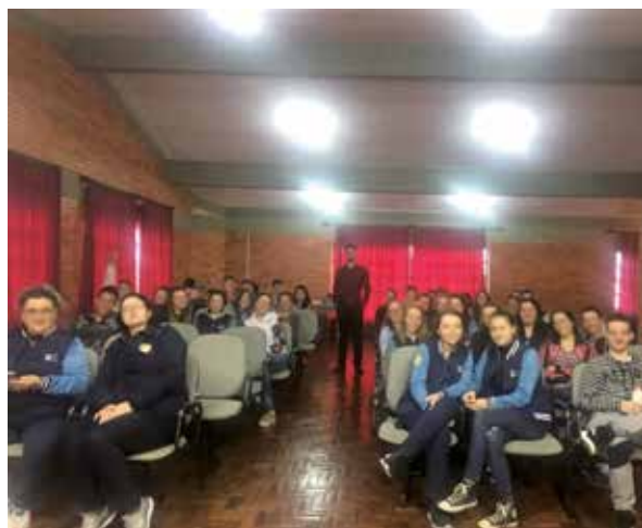
Figura 7 – Palestra sobre Educação Fiscal proferida aos alunos e professores da Escola Estadual de Ensino Médio Padre Domênico Carlino, Putinga/RS, em 2019

Outro exemplo de trabalho de conclusão de curso é a criação da página do Facebook "Reforma Tributária: O que eu tenho a ver com isso?", apresentada por dois alunos do curso, na qual notícias e artigos relacionados à temática fiscal são publicados. Desse modo, através dos projetos práticos, é possível atingir um público maior, disseminando conhecimentos sobre a temática fiscal, catalisando assim, o crescimento da prática cidadã.