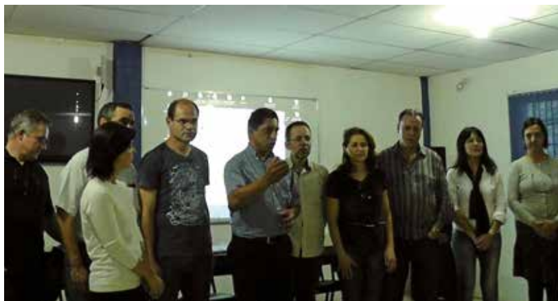
Figura 4 - Encerramento da 2ª edição do Curso ofertado no Centro de Promoção da Criança e do Adolescente (CPCA) com a presença dos docentes do curso e líderes da comunidade da Lomba do Pinheiro – Porto Alegre em 2016

Uma rotina de aulas bastante diferente da normalmente usada na Universidade foi implementada para o público diversificado e com variado grau de instrução. As aulas iniciavam normalmente com uma apresentação musical, atividade que aproximou os alunos e criou um ambiente acolhedor para a discussão dos temas do curso.