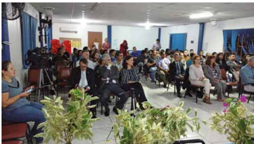
Figura 5 – Lançamento da 6ª edição do Curso de Promoção da Criança e do Adolescente (CPCA) no Bairro Lomba do Pinheiro/POA/RS, em 2018

Com o objetivo de qualificar o curso de Educação Fiscal e Cidadania, o Grupo Gestor avalia criteriosamente cada edição, identificando as fragilidades, forças e potencialidades do projeto. Os eixos básicos e conceitos são apresentados em cada edição. No entanto, o grupo de trabalho mantém o curso atualizado e dinâmico, de forma a analisar demandas e acompanhar a conjuntura sobre os temas abordados.