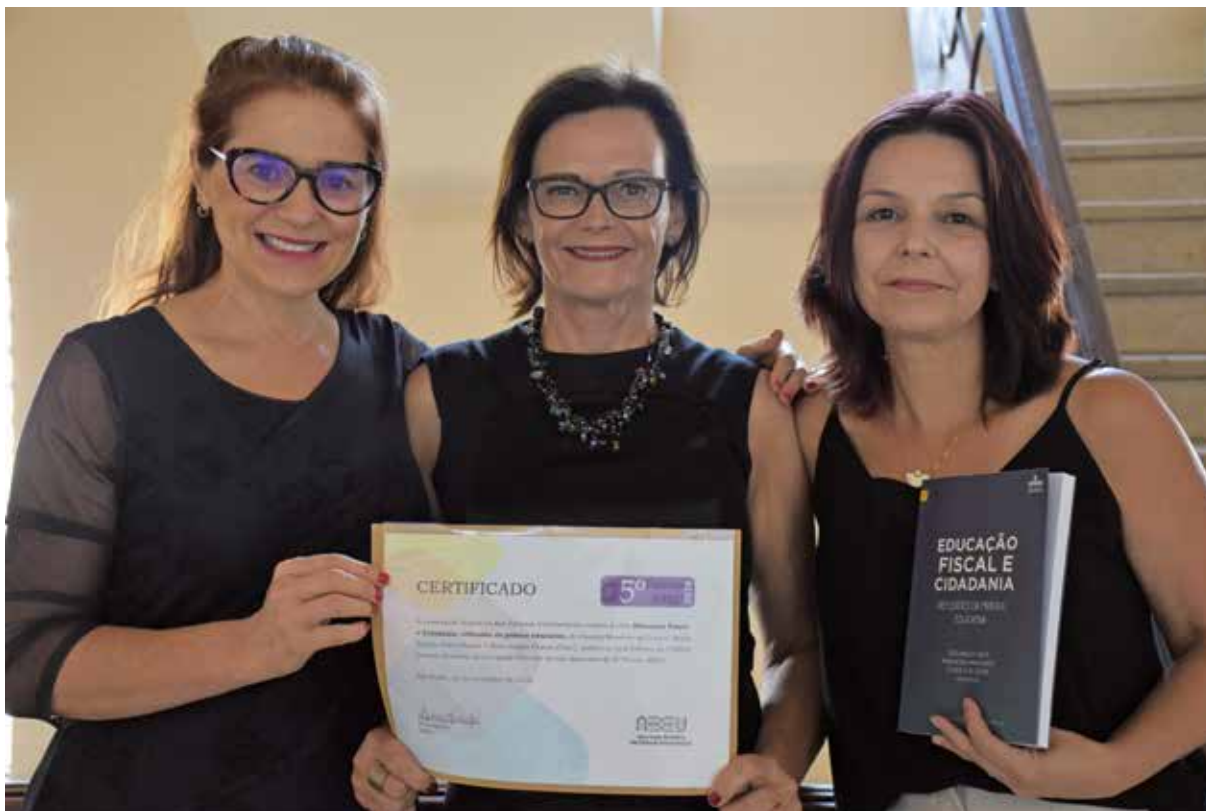
Figura 9 – Organizadoras do Livro e Certificado de Menção Honrosa ao Livro “Educação Fiscal e Cidadania: reflexões da prática Educativa”, concedido pela Associação Brasileira das Editoras Universitárias, em 2019