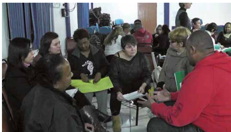
Figura 3 - Aulas de Desenvolvimento de Projetos para lideranças comunitárias do Bairro Lomba do Pinheiro - no Centro de Promoção da Criança e do Adolescente (CPCA) - 2º edição/2016

Na comunidade do referido Bairro, o curso contou com o apoio logístico dos movimentos sociais e trouxe para a sua grade de atividades os momentos lúdicos que são normalmente utilizados em reuniões, seminários e atividades realizadas pela comunidade. Como as lideranças comunitárias da região são bastante ativas e têm uma participação expressiva na gestão do orçamento participativo de Porto Alegre e nas demandas por melhorias da região, foi muito exitosa a realização do curso.