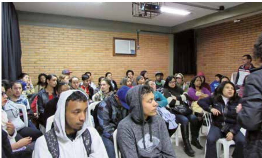
Figura 2 - Disseminação da educação fiscal pelos alunos do Curso de Extensão aos alunos do Curso da Escola Municipal Afonso Guerreiro – Bairro Lomba do Pinheiro -Porto Alegre - 2º edição/2016