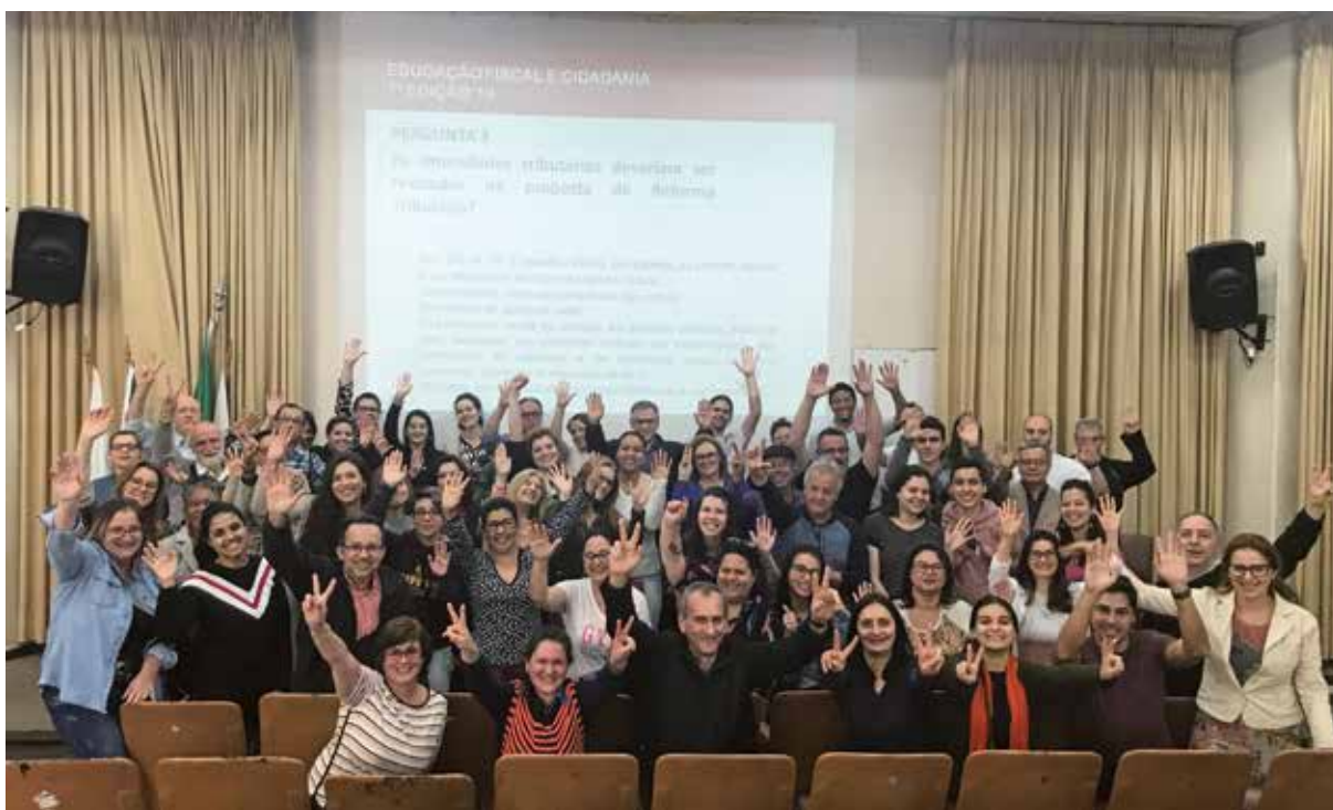
Figura 6 – Encerramento da 7ª edição do Curso Educação Fiscal e Cidadania na FCE/UFRGS em 2019

E a sétima edição, ofertada na FCE/UFRGS, em 2019, (Figura 6) teve carga horária de 60 horas,