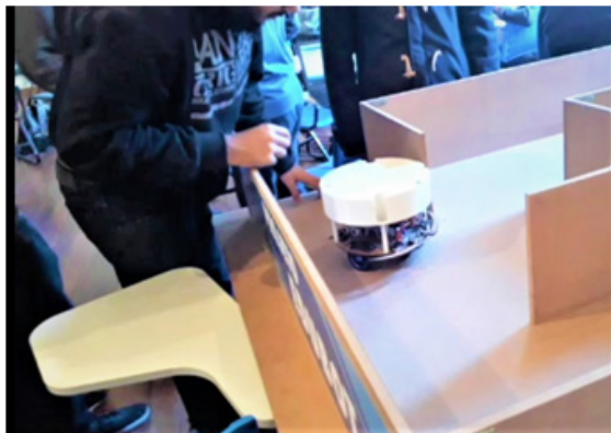
Figura 2. O robô entrando no labirinto.

Os robôs programados pelos grupos de alunos utilizam tecnologia embarcada para percorrer o labirinto de forma autônoma ( Fig. 2 ).