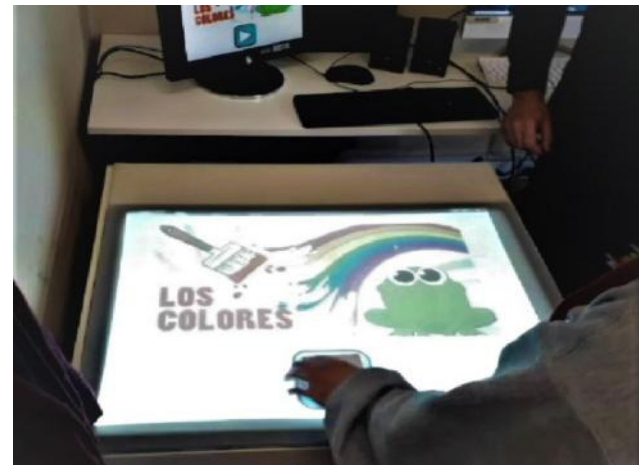
Figura 4. Objetos posicionados sobre a mesa de interação tangível.