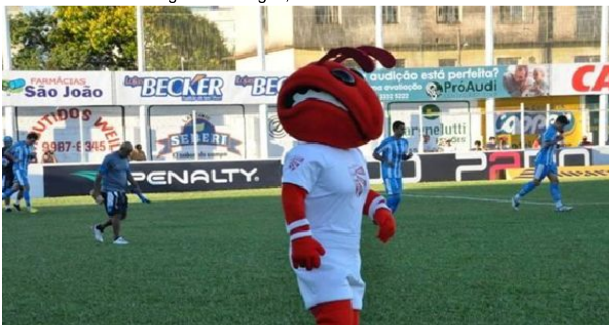
Figura 6 - Zangão, o mascote do São Luiz

Os símbolos adotados pelas torcidas, são incorporados de diversos modos, sem seguir um padrão, podendo representar e enfatizar origens sociais ou valores morais que permeiam a sociedade, [...] remeter a localidades geográficas, ao ethos de um determinado lugar, às cores, aos estereótipos sociais e étnicos, qualidades e virtudes atribuídas aos seres da natureza, animais, santos... (TOLEDO, 1996, p. 54)