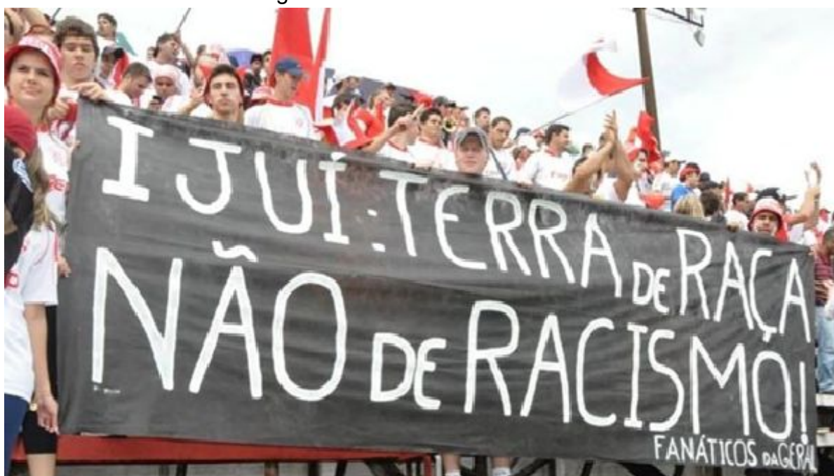
Figura 5 - Faixa contra o racismo

Nota-se tanto na fala do presidente, quanto na ação da torcida, que a identidade com Ijuí está presente. O medo da repercussão do ocorrido, pela mídia, motivou a defesa feita por sua comunidade, a fim de proteger o nome do município.