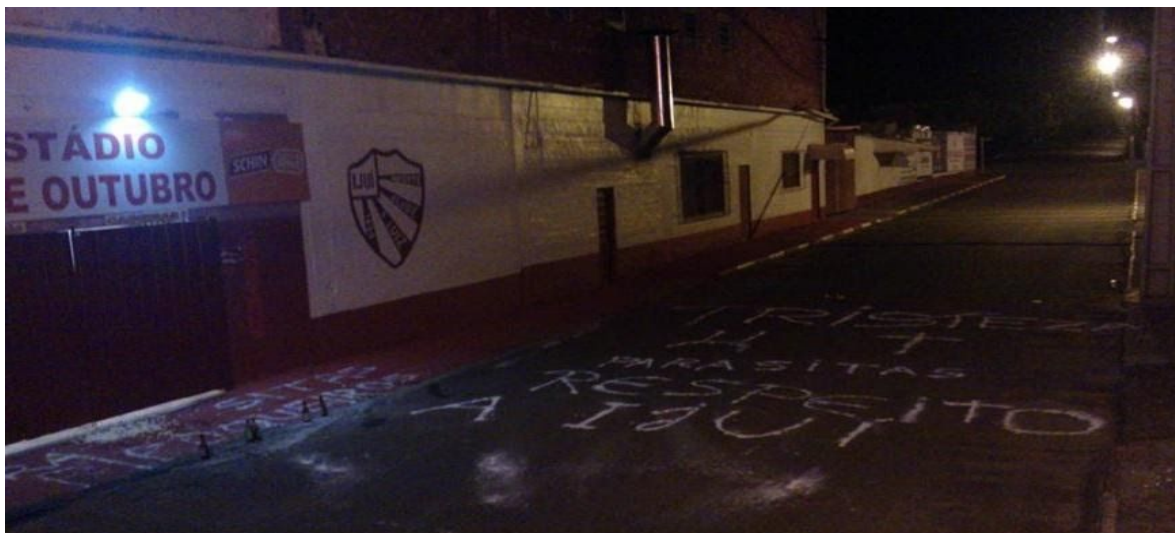
Figura 11 - Protesto no estádio em 6 abr. 2014