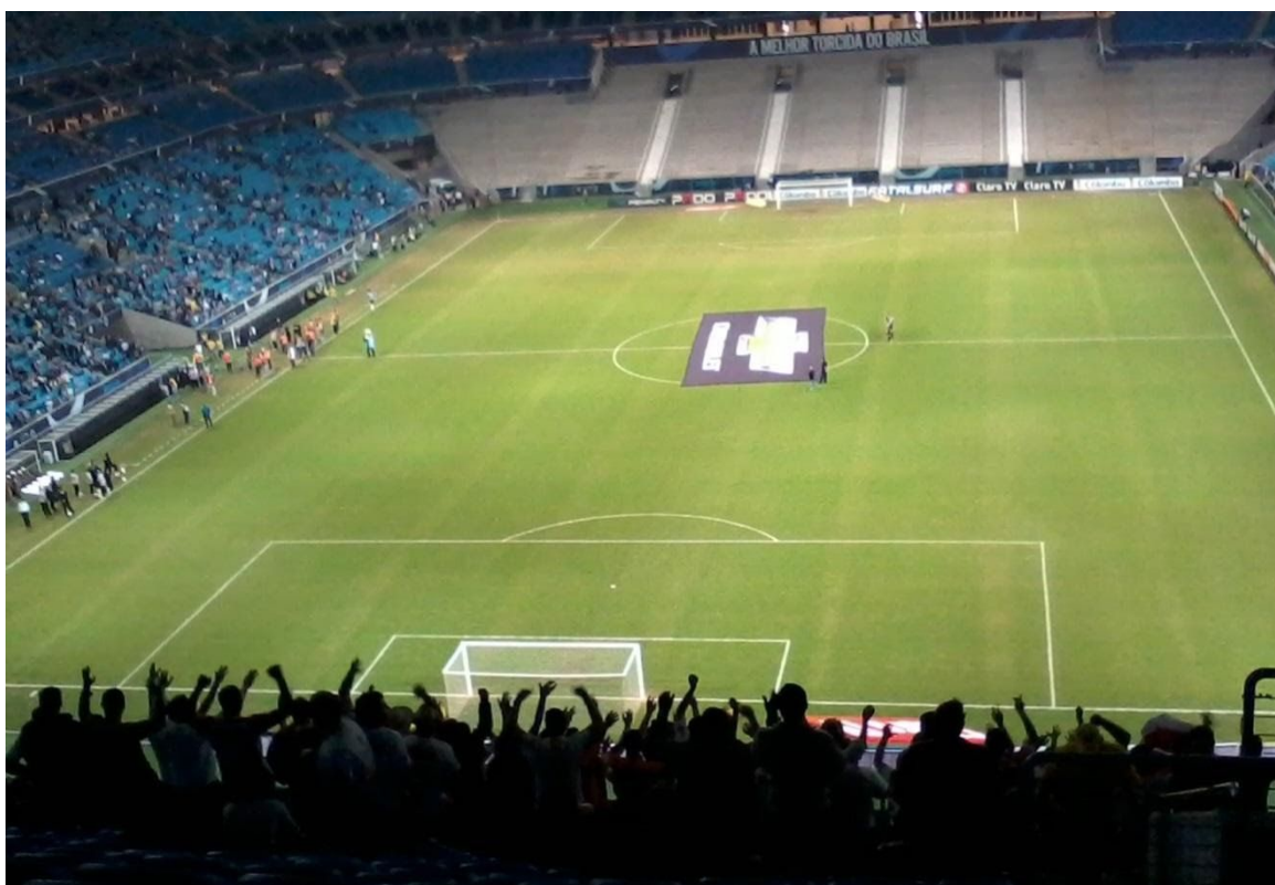
Figura 4 - Torcida do São Luiz na Arena Grêmio em 22 abr. 2013

Aos que assistiram ao jogo em Porto Alegre, pode-se dizer que sentiram saudade de casa. O sol, a chuva e o concreto, pareciam agradáveis em comparação aos seguranças da Arena. No momento em que um estádio antigo como o da Baixada se torna mais confortável que uma Arena, recém inaugurada, busco em alguns autores sustentação para explicar tal sentimento: segundo Damo (2002) “ter estádio próprio é como ter casa própria”.