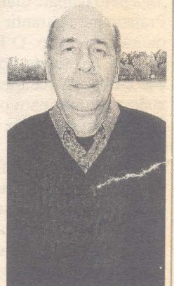
REEBERG: liberdade para os remadores

■ O dirigente visitou terça-feira o Clube Náutico Gaúcho, em Pelotas. No domingo, prestigiará a terceira etapa da Copa RS de Remo, no Grêmio Náutico União, em Porto Alegre.