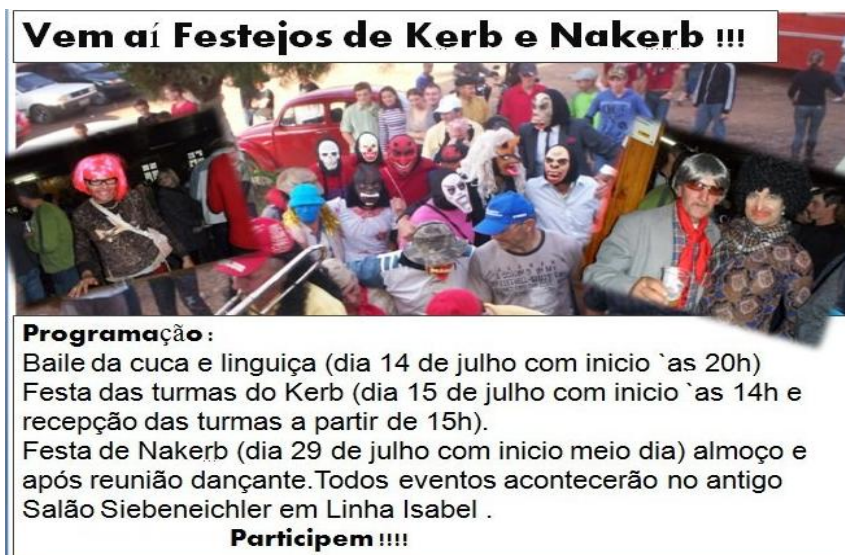
(Figura III – propaganda da festa, contendo imagens dos “palhaços”, elaborada por moradores da Linha Isabel)

É interessante notar a força dessa tradição, que acontece há mais de cem anos na comunidade, de acordo com festejos que transformam agricultores, pais de família, em “palhaços”. Verifica-se que os membros da comunidade elegem o dia do Kerb para promover a diversão, a folia que se espalha e é levada de casa em casa na localidade. A eleição de um único período do ano para a promoção da alegria efusiva e do desregramento lembra, de certa maneira, práticas existentes desde a Grécia Antiga, regida por Apolo, mas que consagrava um período particular a Baco. Festejos desse tipo lembram, inclusive, a famosa prática do carnaval, desde os tempos medievais, como o explorado por Rabelais e, mais tarde, divulgado ao público sob a perspectiva de Bakhtin através de uma publicação ( A cultura popular na Idade Média ao Renascimento: o contexto de François Rabelais ) que apresenta uma síntese entre o popular e o imaginário – relação que estimula a exploração do riso como recusa ao poder instituído, em favor da afirmação da vida absoluta.