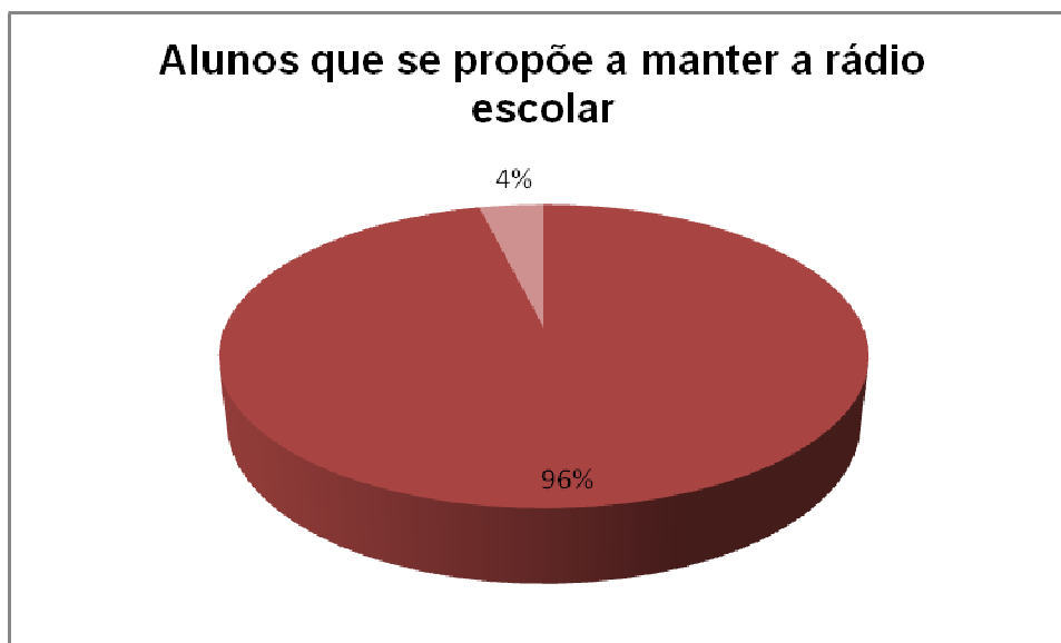
Gráfico 3 Números de alunos que manteriam a rádio escolar

Referindo-se ao gráfico acima, percebe-se que 96% dos sujeitos da pesquisa gostariam de manter a rádio escolar em funcionamento, ou seja, 25 alunos do grupo se mostraram favorável, sendo que apenas 01 não achou interessante a proposta.