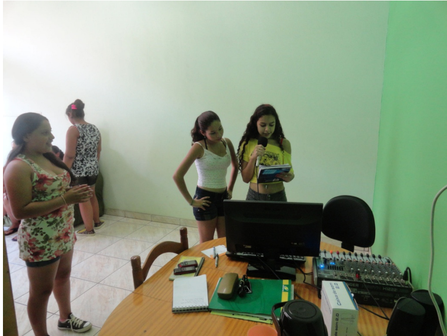
Figura 1 Alunos gravando o programa da Rádio Escolar