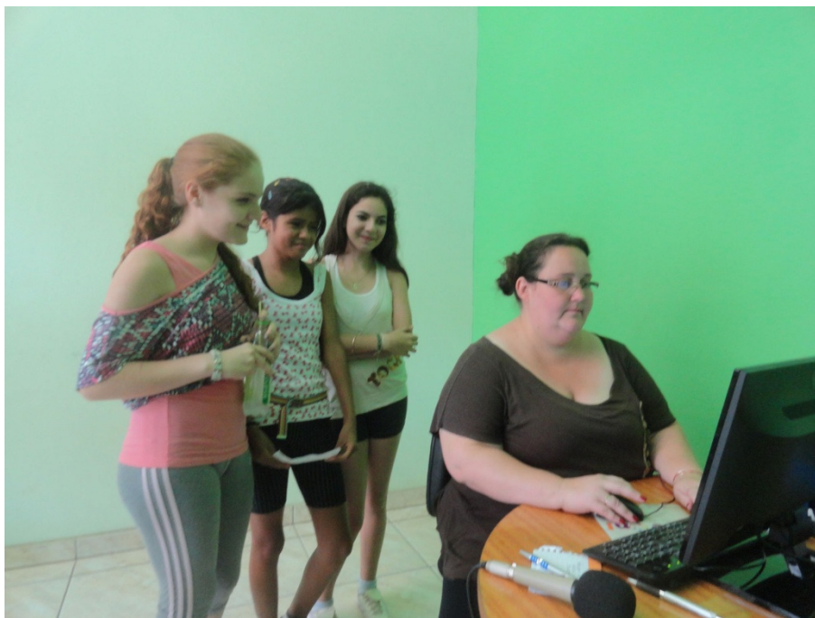
Figura 1 Alunos escutando a programação antes de “ir ao ar”